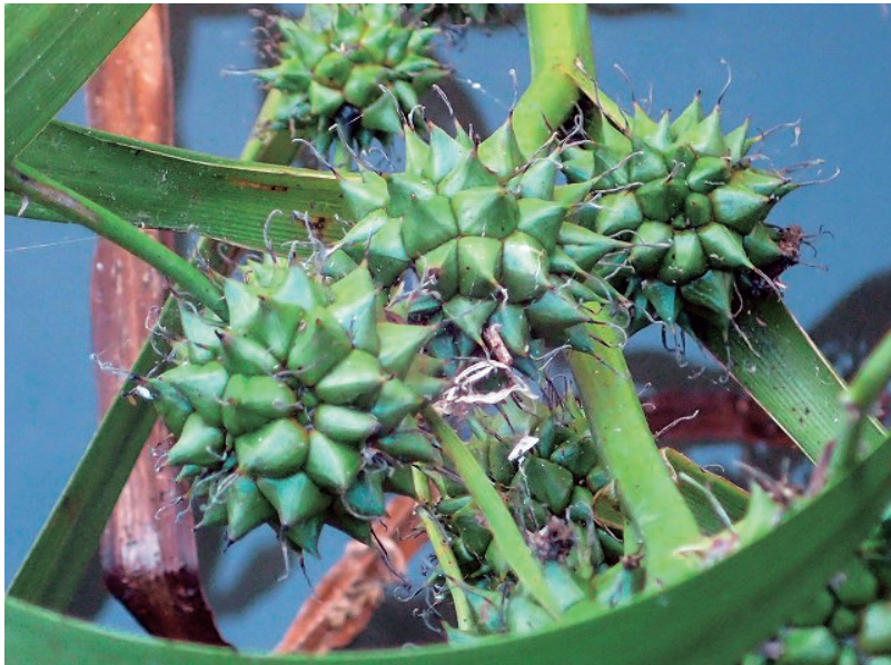
オオミクリ（新居見町神田瀬川）