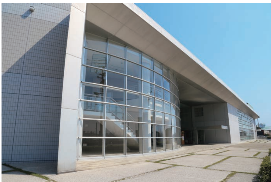
サウンドハウスホール