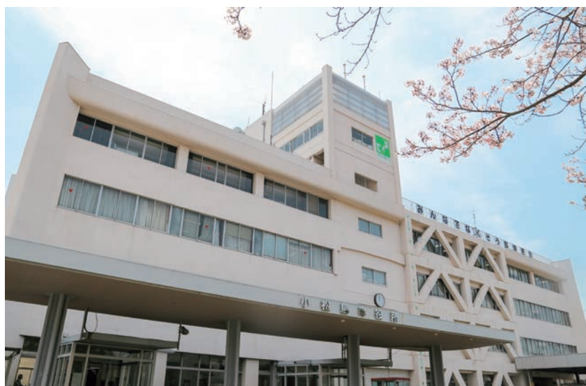
小松島市役所庁舎