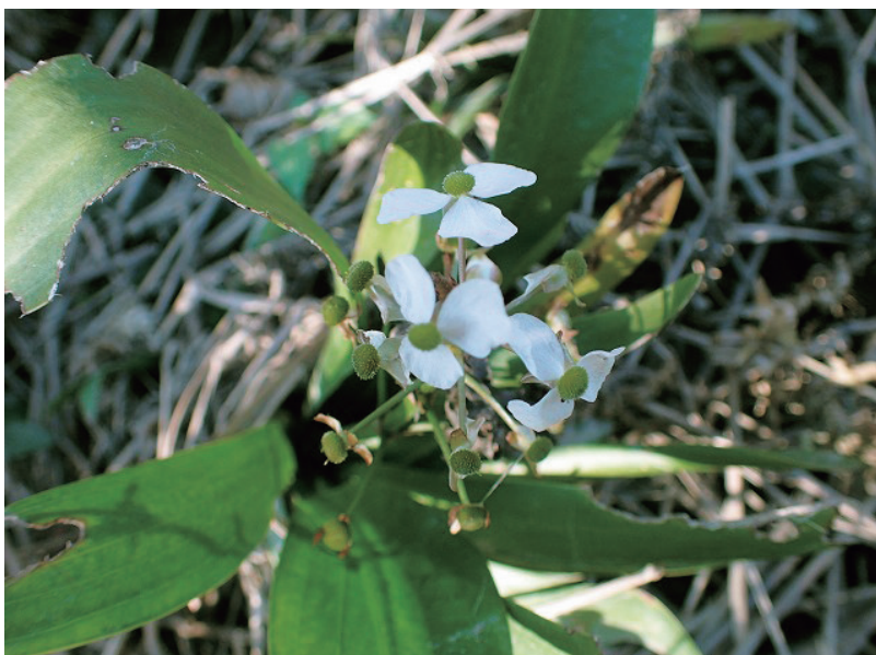
ナガバオモダカ（中田駅付近）