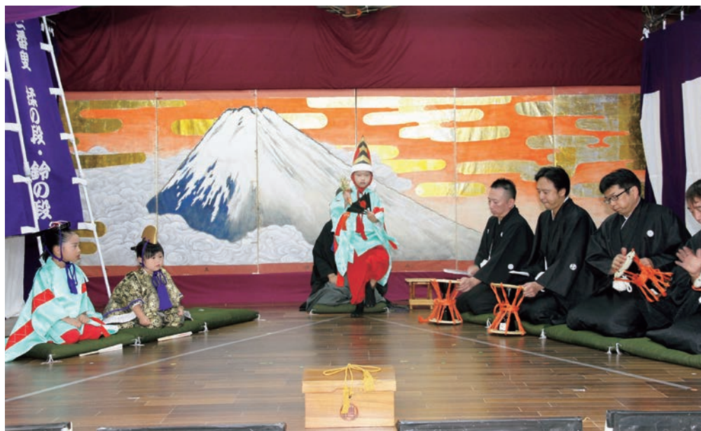
県指定無形民俗文化財 田野の天王社稚児三番叟