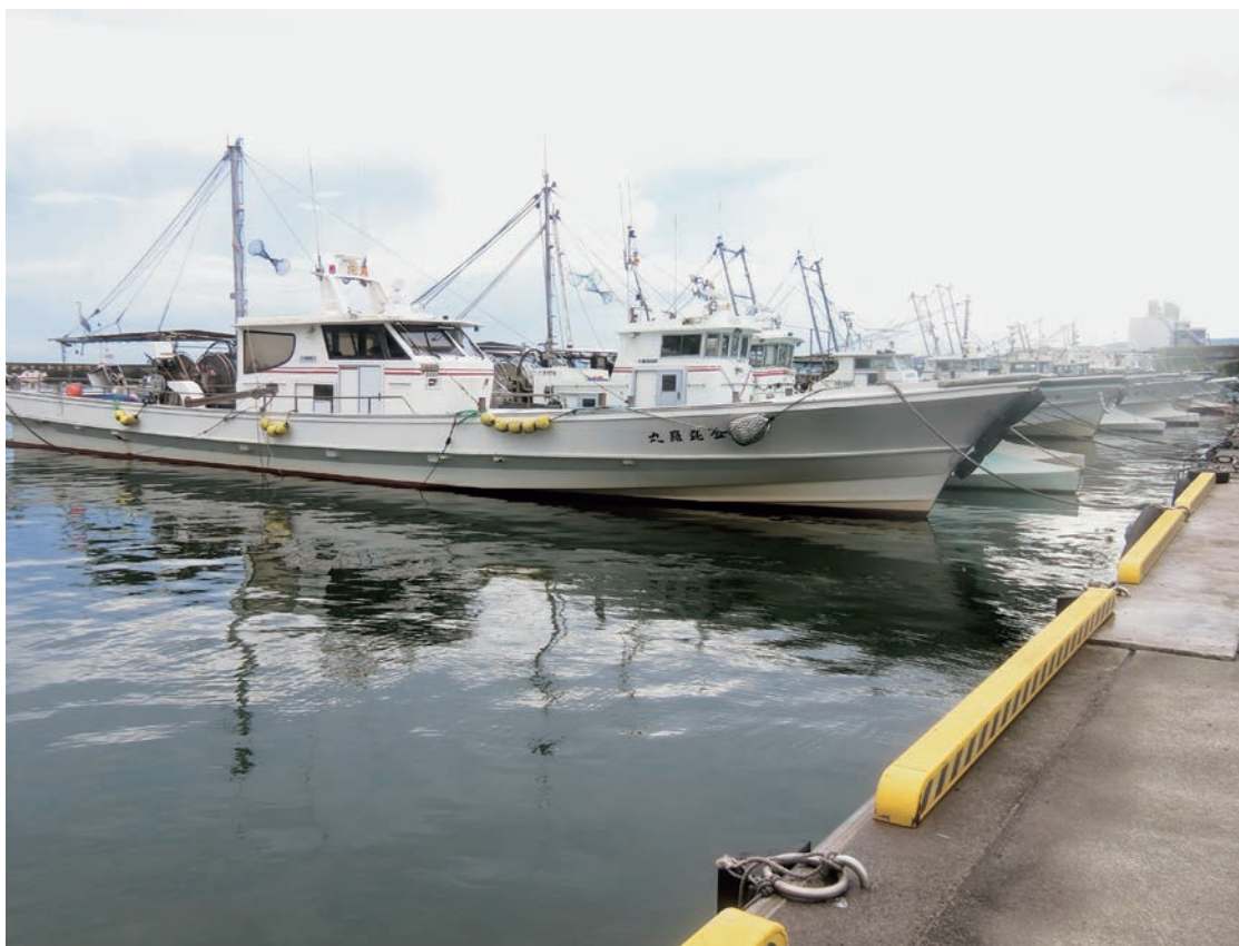
元根井漁港における漁船