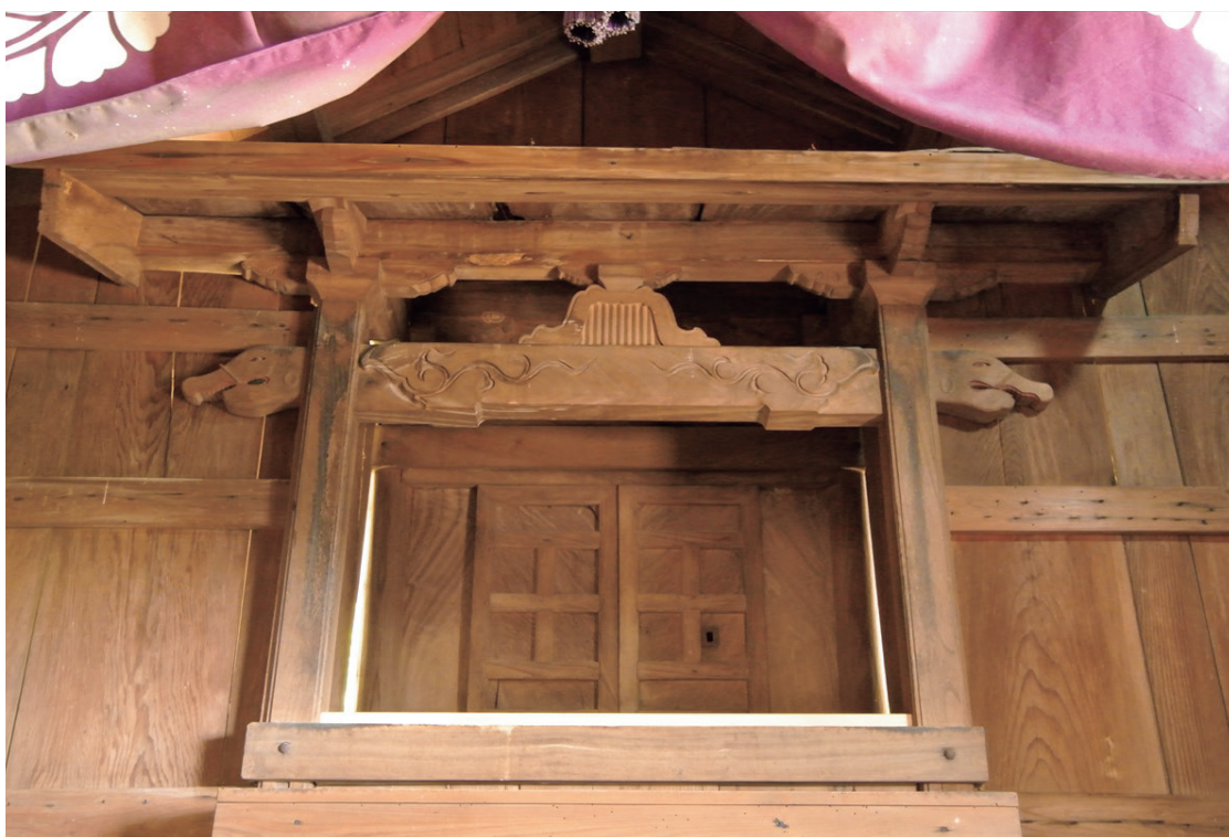
春日神社 本殿正面（新居見町）