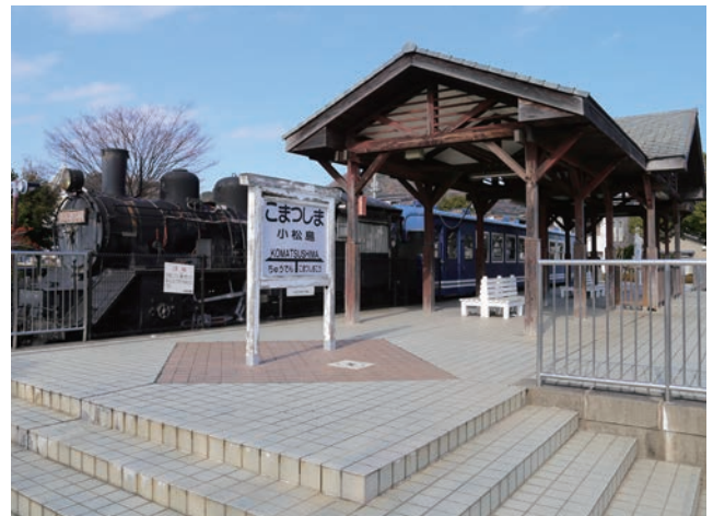
小松島ステーションパークSL記念広場