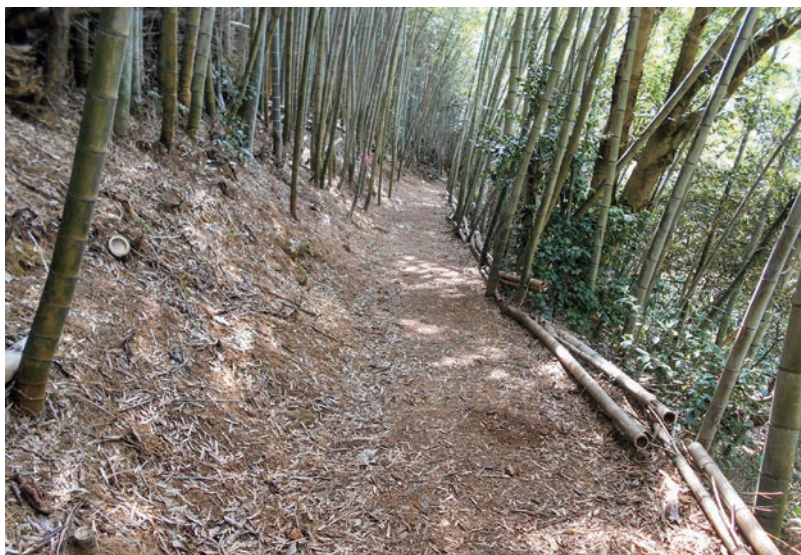
国史跡 阿波遍路道（立江寺道）