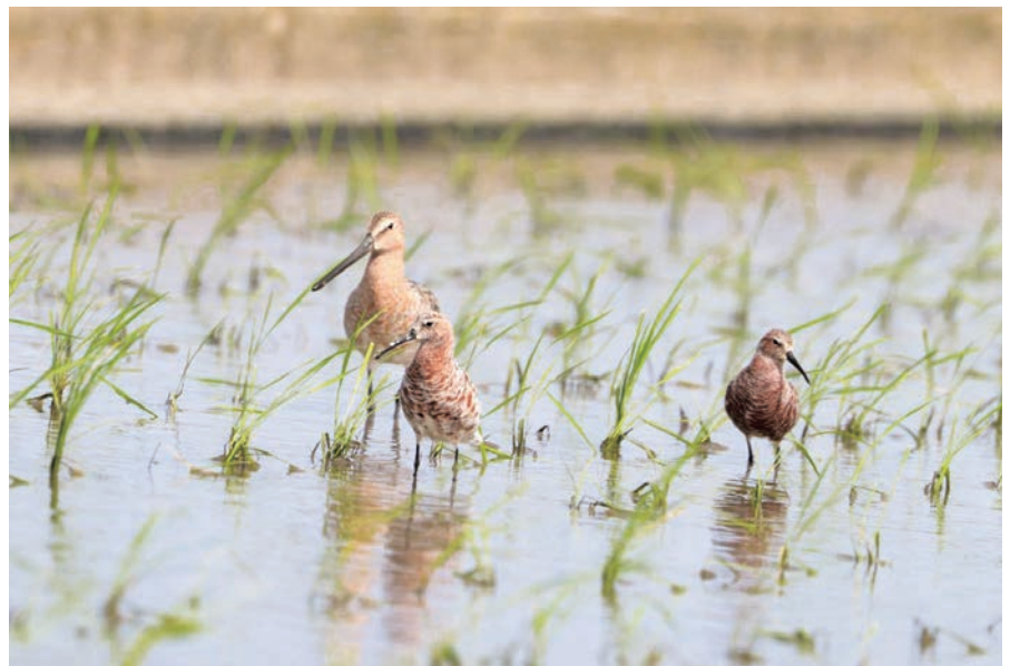
サルハマとシベリアオオハシ