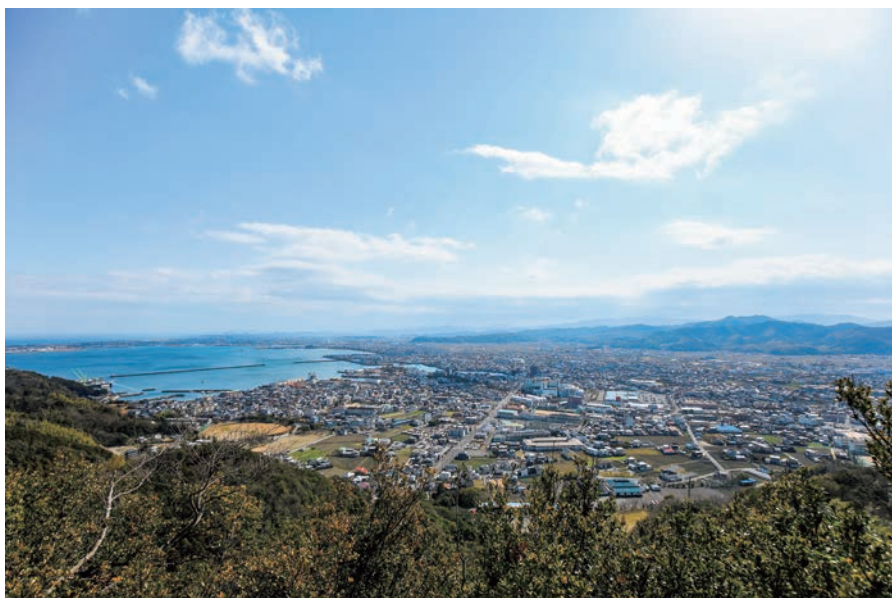
日峰山からの眺め