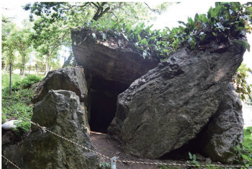
県指定史跡 弁慶の岩屋