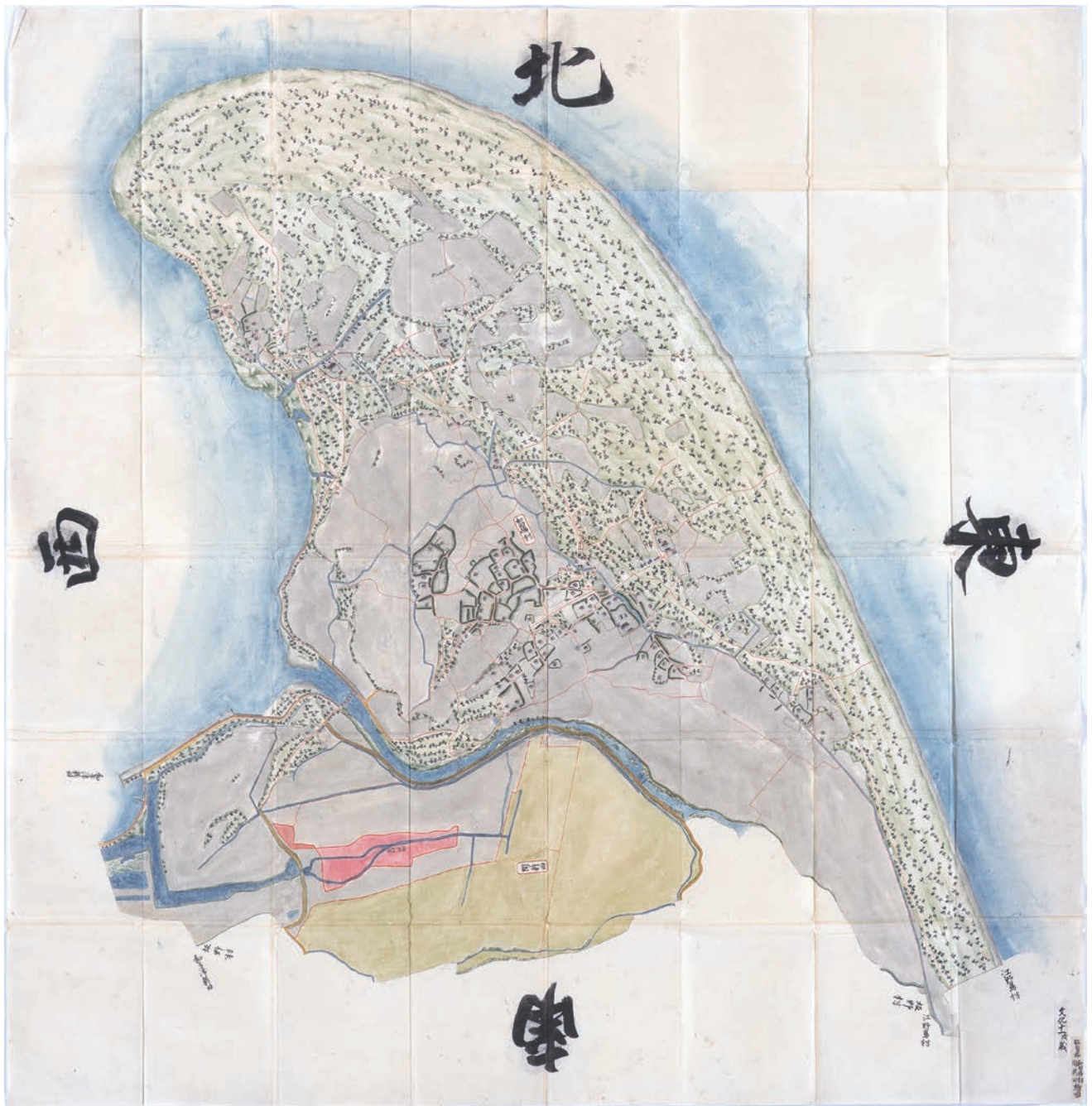
「那賀郡和田島村ノ新田繪図」(和田島北部) 文化11年(1814)