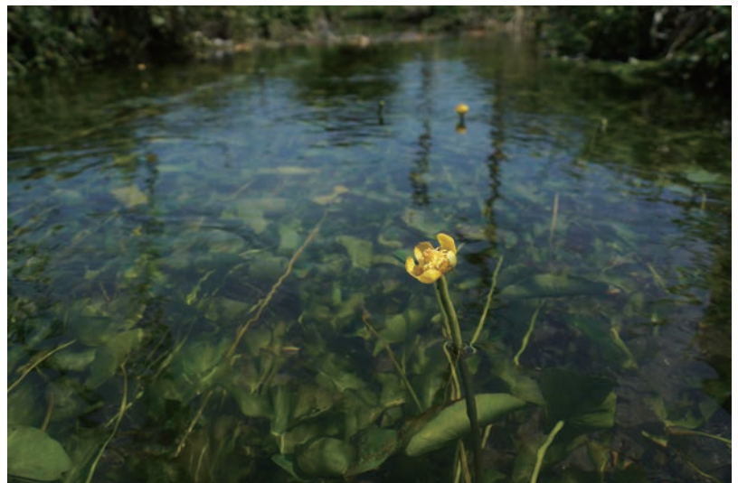
サイコクヒメコウホネ（神田瀬町用水路）