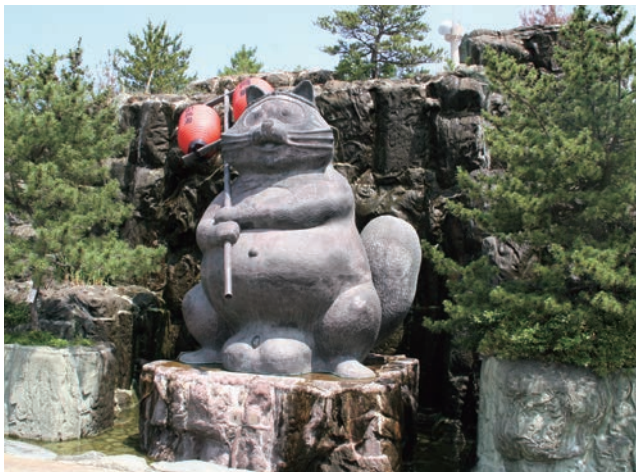
小松島ステーションパークためき広場