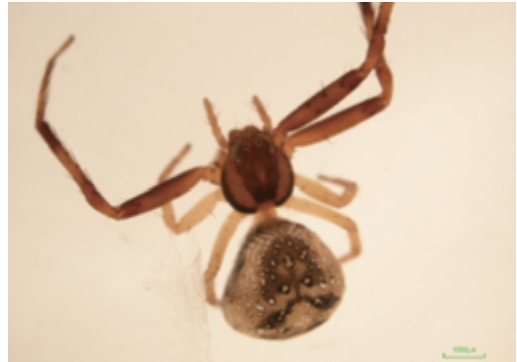
写真11 ナンゴクフノジグモ 雌

体長雌4.2mm前後で雄は未知とされている。腹部背面は淡褐色の地に褐色斑と白色の点斑が並ぶ。今回の調査によって当該地域の多くの地点で採取されたが，高知県・香川県のほか，愛知県・三重県・熊本県でも記録されている。