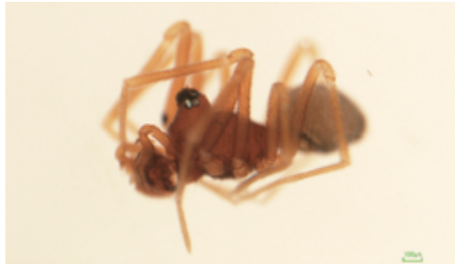
写真8 ミナミアリマネグモ 雄（側面）