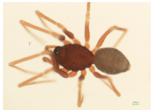
写真7 カンサイアリマネグモ 雌