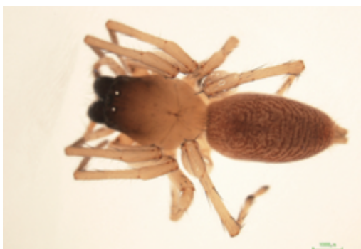
写真21 フクログモ属の一種 雌

体長約8.5mmの雌成体1頭が大木屋上において採取された。腹部背面全体に縞模様が有り, 外雌器も