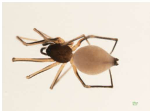
写真2 アシボソケシグモ 雌

体長雌2.0mm, 雄1.5mm前後。腹部は白色で後端は黒い。歩脚が長く全体的にスマートな感じのクモである。杉谷の文化村周辺にて落葉層から採取された。四国では高知県で記録がある。