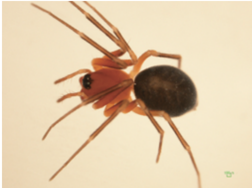
写真4 マダラナンキングモ 雌

体長は雌雄ともに2.1～2.6mm。雄の上顎に1本の尖った刺状突起, 前牙堤に5歯がある。4月から8月にかけて当該地域の多数の地点においてビーティング法で採取された。四国では高知県に記録がある。