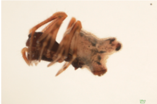
写真13 ヒメグモ科の一種 (I) 雌 (側面)

体長雌約2.5mm, 雄1.9mm。雌を北河内と櫛川上で, 雄を西福良で採取した。採取時期が異なりそれぞれ別に同定をお願いしたが, おそらく同種と思われる。