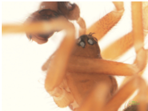
写真9 カントウヒゲヌカグモ 雄（頭部）

体長雌2.3mm前後，雄1.8～1.9mm。霧越峠周辺の落葉層から雄1頭が採取された。雄の頭部が丘形に隆起し，1対の角状の突起を有する。本州に分布するとされ，四国からは初めての記録となる。