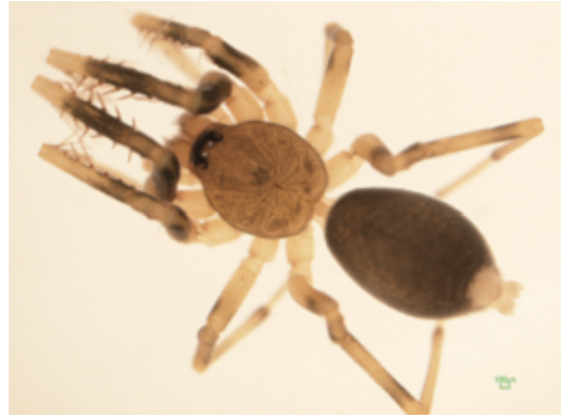
写真22 ナンゴクウラシマグモ属の一種 雌

体長は雌4.0mm, 雄2.9mm前後。当該地域の多くの地点から採取した。雌の外雌器, 雄の触肢ともに既知種とは明らかに異なる。