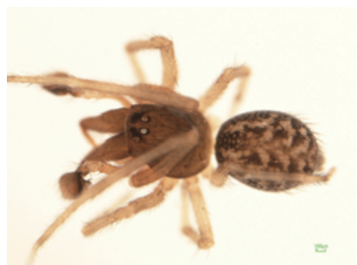
写真18 カレハグモ属の一種 雄