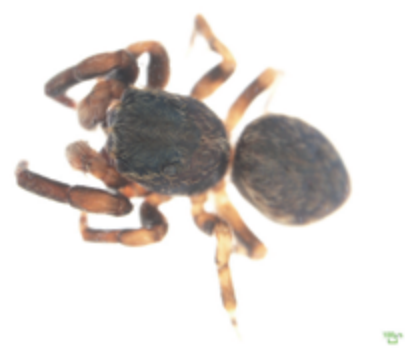
写真24 コハエトリグモ属の一種 雄

体長約3.1mmの雄成体と雌の幼体が上大内で採取された。谷川明男氏及び須黒達巳氏によって未記載種と確認された。