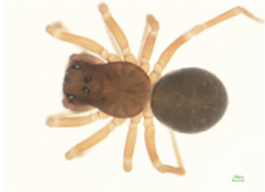
写真6 ズナガコヌカグモ 雄

体長雄1.6mm前後。頭部は全体に幅広く前方に突き出て, 眼域に短毛を密生する独特の形状を示している。雌は未知。霧越峠下方の落葉中から採取した。九州の福岡県・熊本県で記録されているが, 四国では初めての記録となる。