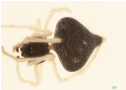
写真14 ヒメグモ科の一種 (II) 雌

体長は雌約2.7mm (雄は未知)。ギボシヒメグモの黒色型に似るが, 腹部後端が大きく伸びて先端部は白色。外雌器の形状も異なる。