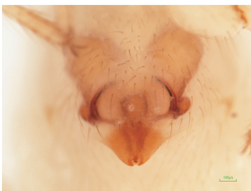
写真15 ホラヒメグモ属の一種 雌 (外雌器)

体長雌雄ともに約4mm。1986年10月及び1987年3月に多良鉱山 (仮称: 下吉野の廃坑) で雌成体2