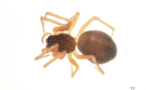
写真5 ヌカグモ 雌

体長雌2.8～3.6mm, 雄2.5～3.0mm。上顎の前牙堤に5～6歯, 後牙堤に3～4歯がある。いずれもビーティング法で採取された。北海道から九州まで広範囲に分布している種で, 四国では高知県・香川県で記録されている。