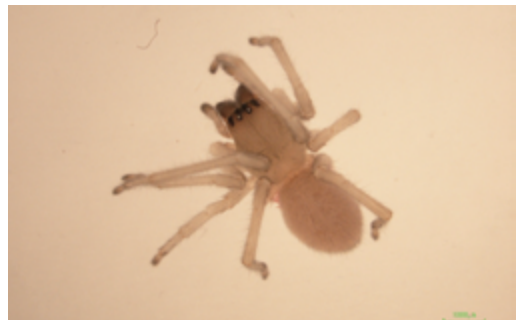
写真23 コマチグモ属の一種 雌

体長約3.1mmの雄成体と雌の幼体が上大内で採取された。谷川明男氏及び須黒達巳氏によって未記載種と確認された。