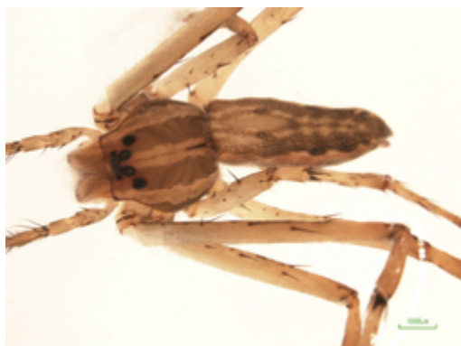
写真10 ヒゲナガハシリグモ 雌

体長雌10mm前後，雄8mm前後。歩脚や雄の触肢が非常に長いのがこの種の特徴である。高知県の他和歌山県・宮崎県・鹿児島県で記録されている。