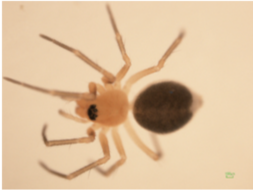
写真3 サイトウヌカグモ 雌