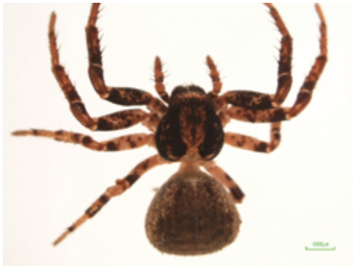
写真19 オチバカニグモ属の一種 雌

体長雌は約6.0mm, 雄3.7mmの小型のカニグモ。 1987年の旧海部町の報告書でニッポンオチバカニグモ Oxyptila nipponica Ono, 1985と記録された種と同種と思われるが, 雌の外雌器及び雄の触肢ともに既知種とは異なっている。徳島県内の他地域で記録されているオチバカニグモについての再検討が必要となった。この種は当該地域の広範囲に渡って生息している。