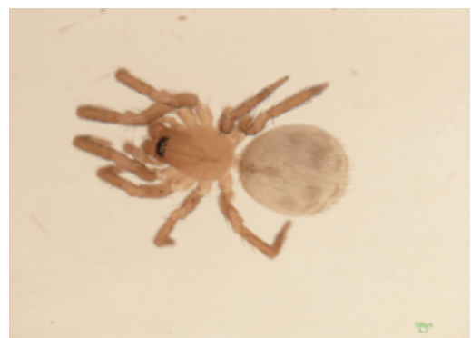
写真17 コタナグモ属の一種 雌