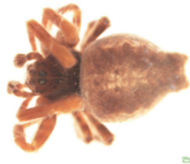
写真1 キヌアミグモ 雄 (幼体)

体長は雌9.0～12.0mm, 雄3.0～4.0mm。腹部は後方に少し伸び、横に二分する。浪切不動尊にて雄の幼体が1頭採取され、谷川明男氏によって本種と同定された。四国では高知県に記録がある。