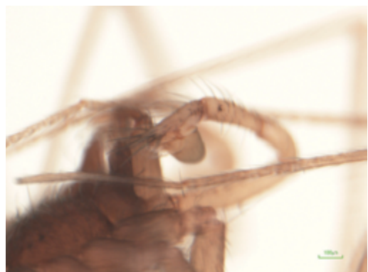
写真12 ヨコフマシラグモ属の一種 雄（触肢）

この種は1987年の旧海部町の総合学術調査報告書でマシラグモ科の一種（B）として報告された種であるが，標本が筆者の手元に残ったままで未だ種が確定されていない。今回の調査によって改めて杉谷で生息が確認された。雄触肢の形状から未記載種と思われる。