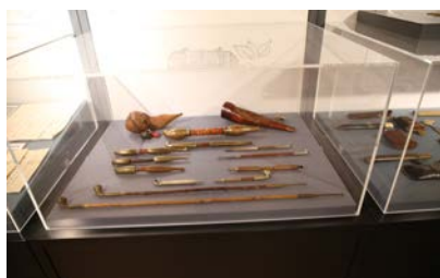
写真10 阿波池田うだつの家・たばこ資料館の民具展示のようす