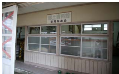
写真7 影野郷土民俗資料館の入口付近