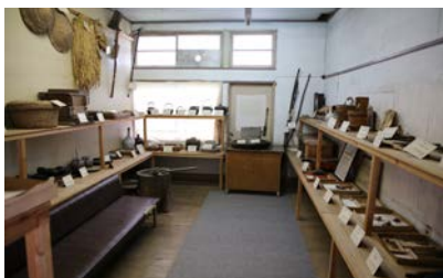
写真8 影野郷土民俗資料館の民具展示のようす