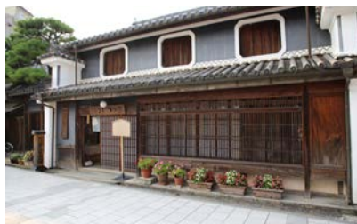
写真9 阿波池田うだつの家・たばこ資料館外観

的な基礎作業はこれまで十分に行われてこなかった (3) 。民具収蔵施設の基礎的な情報の整備は、民具の研究資料としての利用は当然であるが、それ以外にも地域振興，教育，観光等幅広い活用を可能にする情報提供になる。