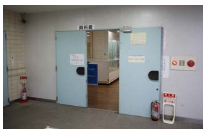
写真3 三好市井川ふるさと交流センター民俗資料館の入口付近