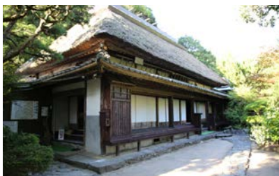
写真17 平家屋敷民俗資料館外観