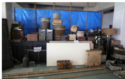
写真6 井川体育館での収蔵のようす