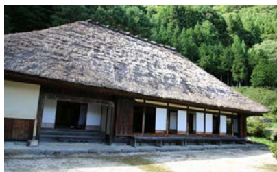
写真13 武家屋敷旧喜多家外観