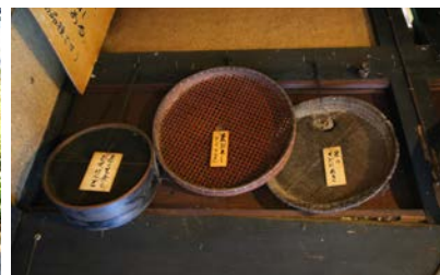
写真18 平家屋敷民俗資料館の民具展示のようす