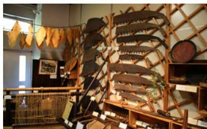
写真16 東祖谷歴史民俗資料館での展示のようす (林業)