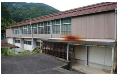
写真5 井川体育館外観