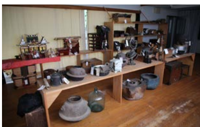
写真2 旧東谷小学校での収蔵のようす