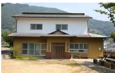
写真11 川崎郷土民俗資料館外観