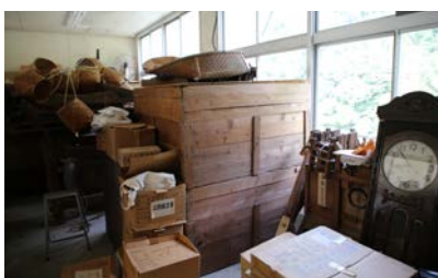
写真20 旧大野中学校での收藏のようす