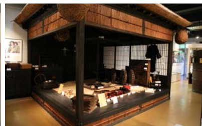
写真15 東祖谷歴史民俗資料館での展示のようす (衣食住)