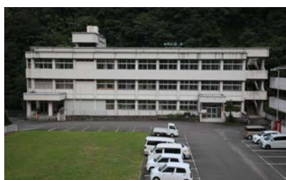
写真19 旧大野中学校外観