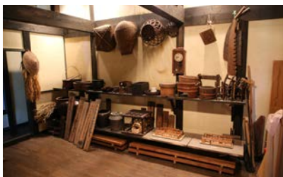
写真14 武家屋敷旧喜多家の民具展示のようす