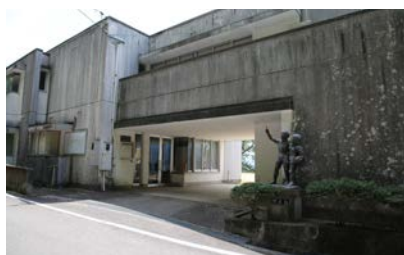
写真1 旧東谷小学校外観