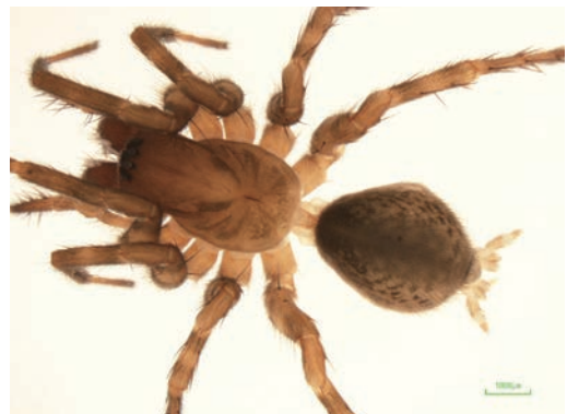
写真4 カミガタヤチグモ种群の一種 ♀