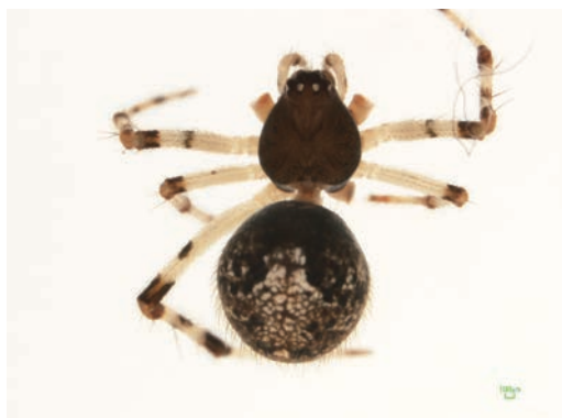
写真17 シモフリヒメグモ 雌成体

での確認となった。水ノ口峠（1 ♀a）及び日ノ丸山林道（2 ♀y 1 ♂y）でビーティングにより採集された。