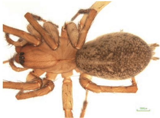
写真3 ヒメヤマヤチグモ ♀

愛媛)で確認されているが、筆者が雌雄成体を採集できたのは初。他のヤチグモ類が落葉層や樹皮下などで網を張るのと異なり、草間に棚状の網を張っており、ビーティングによって採集された。