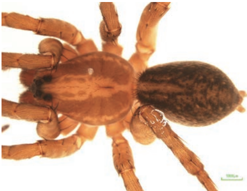
写真12 アライトコモリグモ 雌成体

雌成体で体長10.5mm。北海道・本州に棲息。腕山牧場道路脇の刈草中から雌成体1頭と雌雄幼体それぞれ2頭を採集した。四国からの記録は初めてである。