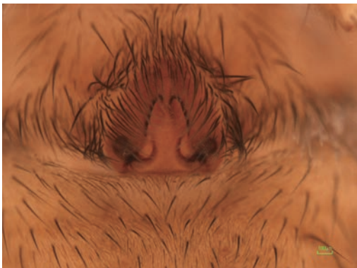
写真13 アライトコモリグモ 雌外雌器