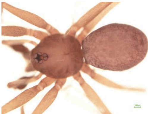
写真1 クロゲマシラグモ ♂

高知県「龍河洞」から記載されたマシラグモで、♂触肢の脛節には長い1本の突起がある。本県では1976年に阿南市の鍾乳洞「竜の窟」での記録が残っているが、「竜の窟」は石灰採掘のためにすでに消滅しており、その後は確認されていない。阿南市の同地域では2016年に同属のアナンマシラグモ Falcileptoneta anannensis Irie が新種記載され、過去の記録には疑問が残る。この度の調査では、祖谷トンネルの上部にある尾井ノ内で5♀a1♂aが採集された。なお、近似のゼンジョウマシラグモ Falcileptoneta zenjoensis (Komatsu, 1965) が瀬戸内(1♂a)、善徳東(1♀a2♂a)から採集されており、両種の境界が興味深い。