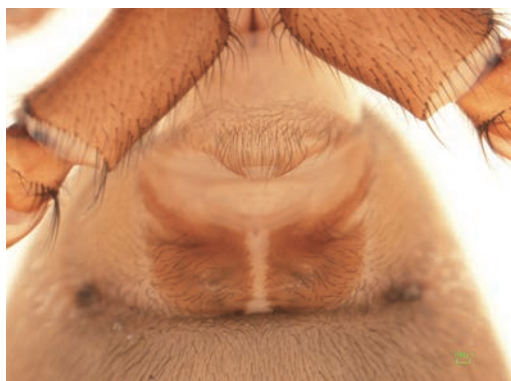
写真7 カメンヤチグモ 外雌器