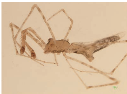
写真18 ヒゲナガヤリグモ 雄成体

本州・四国・九州・南西諸島に分布するとされているが、筆者は今回初めて徳善で雄成体2個体を確認することができた。体長は約4mm。同地点で雌の若い個体が多数見られたが、幼体のために種までは確認することができなかった。