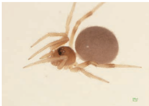
写真19: コアカクロミジグモ 雌成体

Yaginumena mutilata (Bösenberg et Strand, 1906)