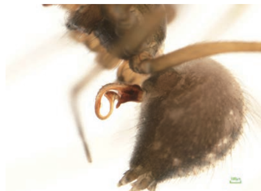
写真16 ヤミサラグモ属の一種 雌外雌器

西祖谷山地域の北部に当たる松尾川北岸地域の水の口峠周辺(1♀a1♂a), 腕山牧場(1♀a2♂a2♀y1♂y)及び瀬戸内(3♀a3♂a5♀y1♂b)の林内落葉層から♀外雌器の形状が明らかに異なるヤミサラグモ属の一種が確認された。既知種との詳細な比較検討とともに、ヤミサラグモ類の分類専門家に依頼して明らかにしたい。