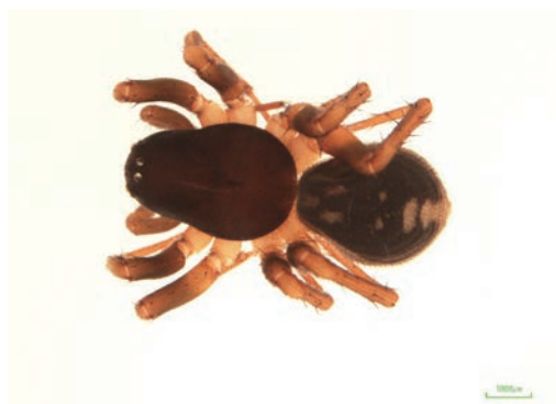
写真10 ドウシグモ ♀成体

この種は、1974年に♀幼体1頭が池田町で確認されて以来徳島県内での採集例はなく、徳島県絶滅危惧Ⅰ類（環境省：情報不足）に指定されている。その後、2010年に吉野川市の高越山及び皆瀬でそれぞれ幼体1頭が採集されていたが、今回の調査で、有宮神社（徳善）で1♀y, 尾井ノ内で1♀a1♀y, 五所神社（上吾橋）で2♀a2♀y1bがいずれも落葉層から採集された。全国的にも採集例は少なく、絶滅危惧Ⅱ類・準絶滅危惧種に指定されている県もあるなど稀少な種である。当該地域においてはかなりの生息数が推定できる。