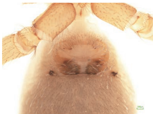
写真9 カメンヤチグモ種群の一種 ♀外雌器