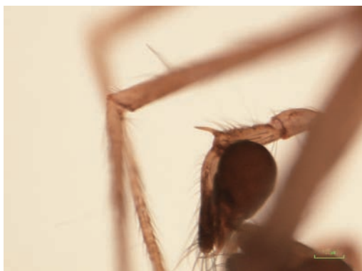
写真2 ♂触肢脛節の突起