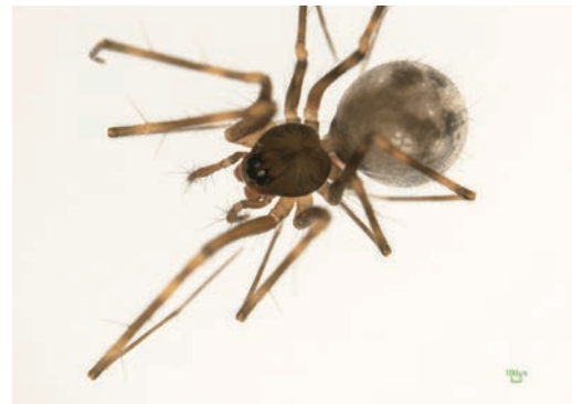
写真14 アワヤミサラグモ 雌成体

筆者は1985年~1986年にかけて、池田町青石で4♀a1♂y, 池田町石内で2♀aを採集し、当時は種名不明だったのが本種である。今回、尾井ノ内で2♀a, 榎で1♀aを確認した。