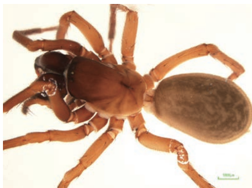
写真6 カメンヤチグモ ♀