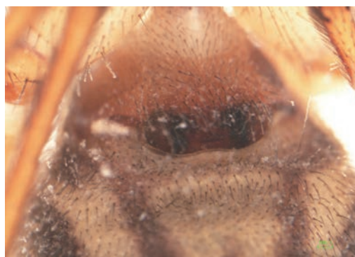
写真11 ドウシグモ ♀外雌器