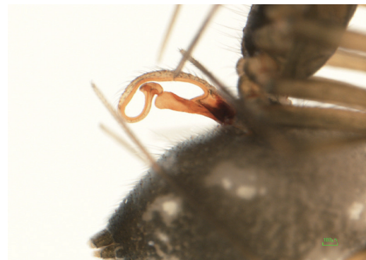
写真15 アワヤミサラグモ 雌外雌器

西祖谷山地域の北部に当たる松尾川北岸地域の水の口峠周辺(1♀a1♂a), 腕山牧場(1♀a2♂a2♀y1♂y)及び瀬戸内(3♀a3♂a5♀y1♂b)の林内落葉層から♀外雌器の形状が明らかに異なるヤミサラグモ属の一種が確認された。既知種との詳細な比較検討とともに、ヤミサラグモ類の分類専門家に依頼して明らかにしたい。