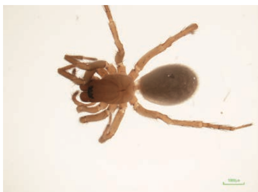
写真8 カメンヤチグモ種群の一種 ♀

腕山南麓から日ノ丸山 (1,240.2m) に続く林道沿いから♀成体1頭が採集された。体長は5.5mmと前種よりかなり小型。外雌器の突起が大きく離れており、明らかに別種である。