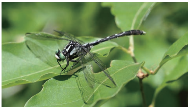
写真7 タベサナエ♂ 縄張り