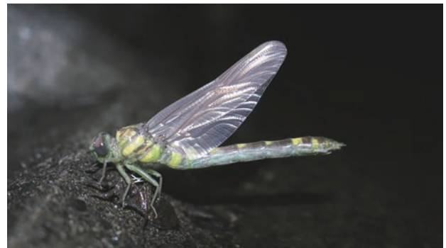
写真6 タイワンウチワヤンマ♀ 羽化