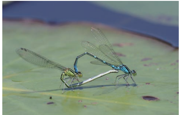
写真1 オオイトトンボ 交尾