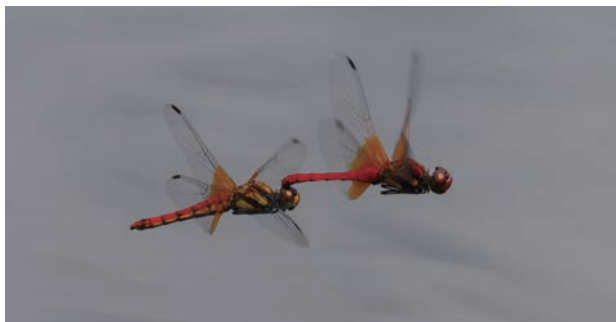
写真 10 ネキトンボ 連結産卵