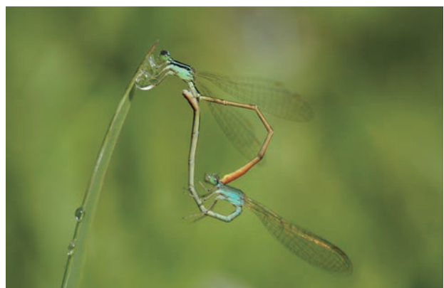
写真2 モートンイトトンボ 交尾