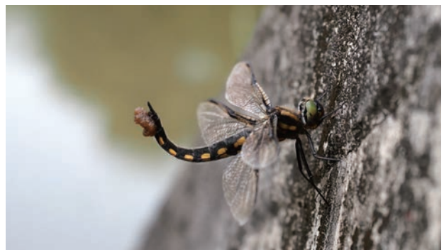
写真8 トラフトンボ♀ 産卵