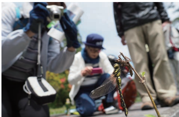
写真3 サラサヤンマ♀羽化 (観察会にて)