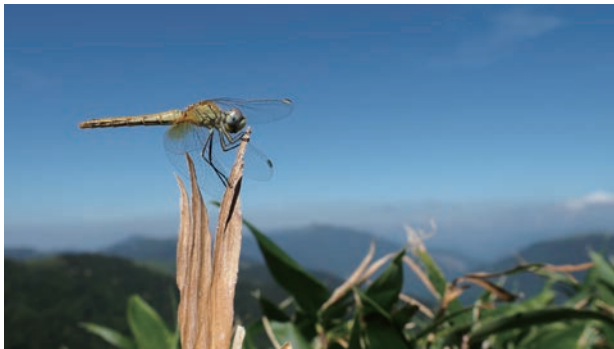
写真9 スナアカネ♀ 未熟