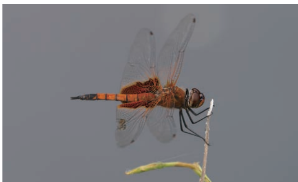
写真 11 ハネビロトンボ♂ 縄張り