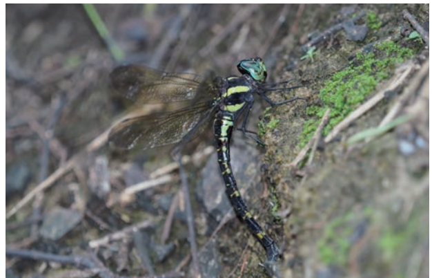
写真4 ヤブヤンマ♀ 産卵