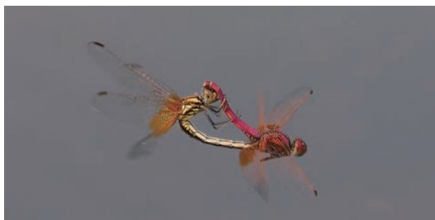
写真 12 ベニトンボ 交尾