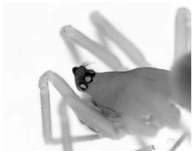
写真4 コテングヌカゲモ ♂頭胸部

雌雄ともに体長2.5mm前後。背甲・歩脚は明るい赤桃色、腹部は灰黒色。雄の頭部は狭くなって前方に突出する。突出部の前方に黒色の太い短毛、後方に細い長毛がある。雄の触肢の頸節前方に板状の突起があり、その先端が4歯(左)5歯(右)に枝分かれしている。キュウシュウツノヌカゲモ Paikiniana iriei (Ono, 2007) と酷似するが、雌の外