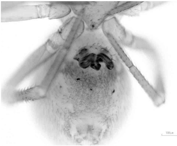
写真5 ヤマトオオイヤマケシグモ ♀外雌器

体長約2mm。背甲・歩脚は黄褐色で、腹部は灰褐色。眼の周囲は黒色。外雌器の形状が特異で、この形状によって本種と判断した。北海道・本州・九州と広範囲に分布するが、四国からは初めてである。 栈敷峠で雌1個体のみでの採集である。