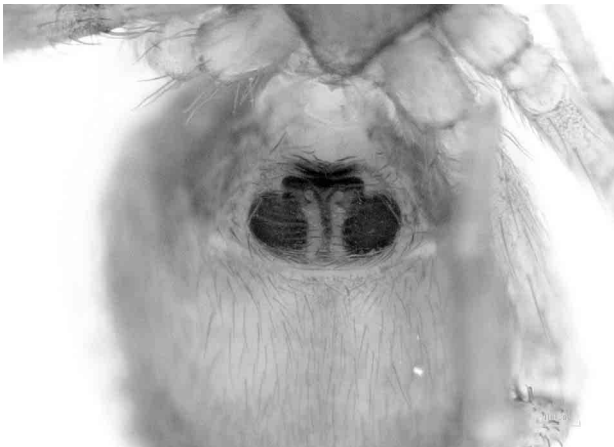
写真1 ムツメカレハゲモ ♀外雌器

韓国から記載された種であるが、日本では関東から中国地方にかけて、また九州では熊本県で確認されているが、四国からは初めての記録である。