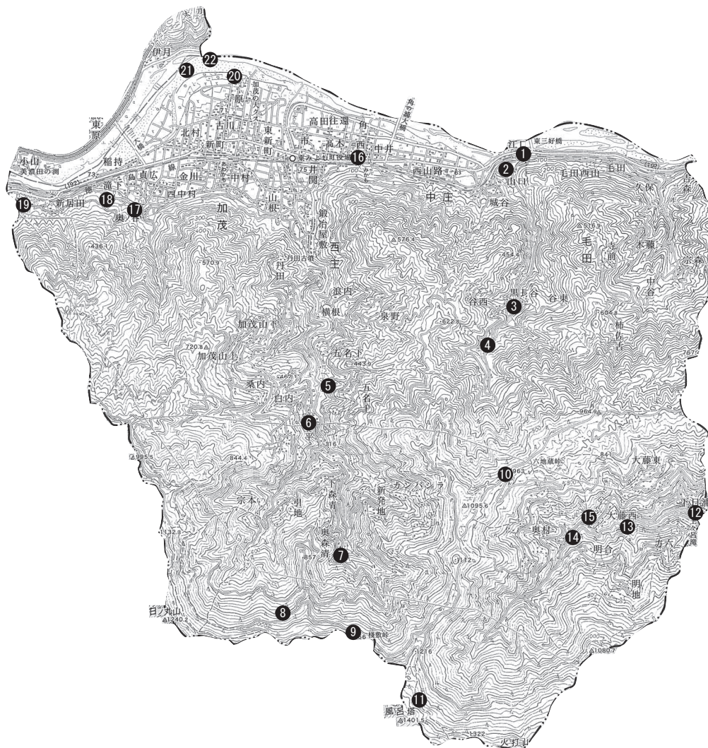
図1 東みよし町「旧三加茂町」での調査場所