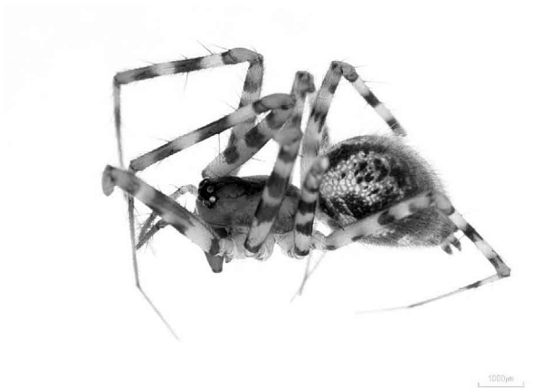
写真6 アズミヤセサラグモ ♀側面

体長約6mm。背甲はくすんだ褐色、歩脚は黄褐色で環斑がある。腹部は灰色で中央部に黒色条と後方になるに従って多数の黒斑がある。日本では本州(中部地方の長野県・山梨県・愛知県)の亜高山地帯に分布するとされているが、全体的な特徴及び外雌器の形状から本種であると判断した。風呂塔キャンプ場周辺で1個体のみでの採集である。