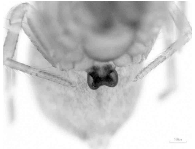
写真3 ヒメウスイロサラゲモ ♀外雌器

体長1.8mm前後、背甲は黄褐色、腹部は灰黒色の小さなクモ。外雌器が前面に突出している。本州・九州そして四国では香川県から記録されているが、本県では初記録である。栈敷峠、水の丸といずれも標高の高い場所の落葉層から採集された。