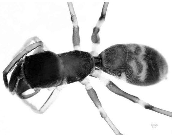
写真8 タイリクアリグモ ♀