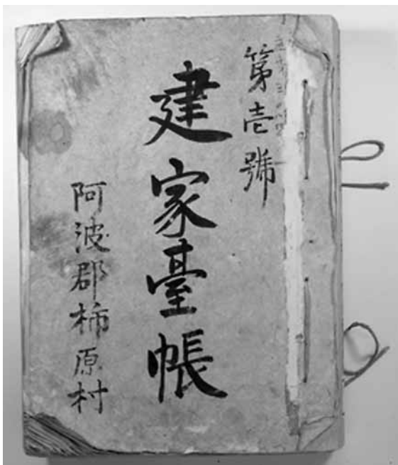
笠井図書館保管 建家台帳 阿波郡柿原村

笠井図書館の書庫には手束家文書などの古文書類のほか、旧吉野町関係の歴史的公文書が保管されている。その中には、村内全ての家屋を地番順に書き上げた「 たてや だいちょう 建家台帳 阿波郡柿原村」などの魅力的