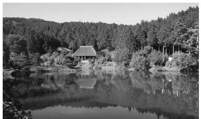
中尾山高原 大森の池 (2007年11月8日撮影)