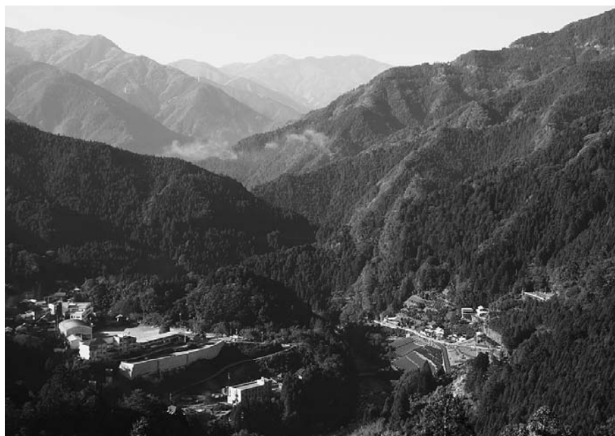
川井峠から総合支所付近・剣山 を望む (2007年11月8日撮影)