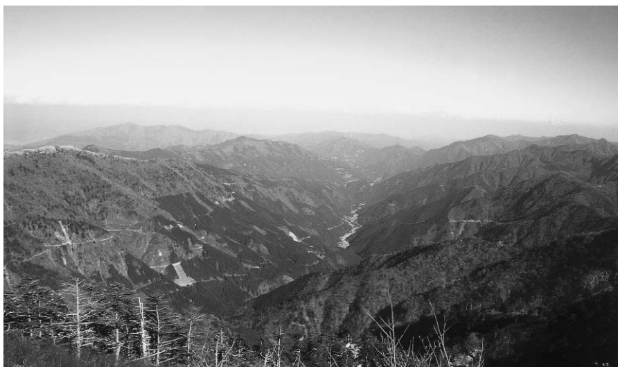
剣山よりみた木屋平