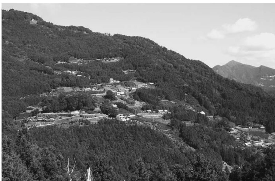
美馬市木屋平字森遠付近 (2007年11月7日撮影)