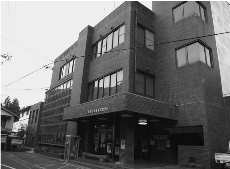
美馬市木屋平総合支所 (美馬市木屋平字川井, 2007年11月8日撮影)