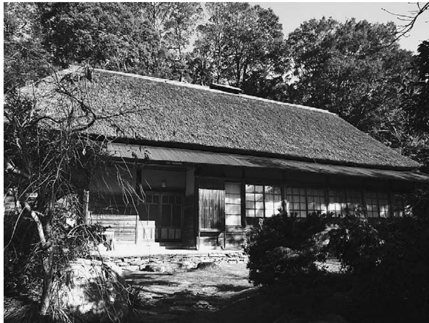
国指定重要文化財 三木家住宅 (美馬市木屋平字 みつぎ 貢, 2007年11月8日撮影)