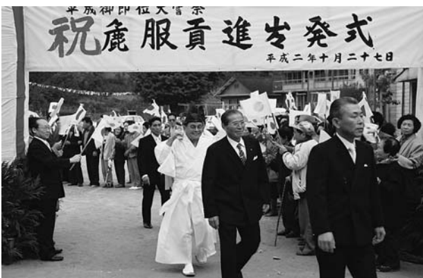
あらたえ 鹿服献上出発式 (1990年10月27日)