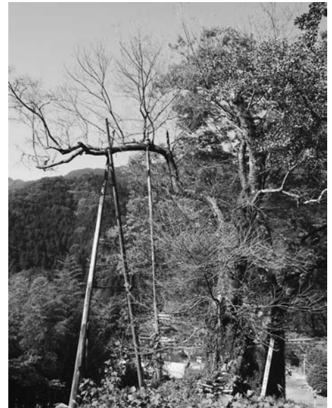
県指定天然記念物 川井のエドヒガン (美馬市木屋平字川井, 2007年11月8日撮影)