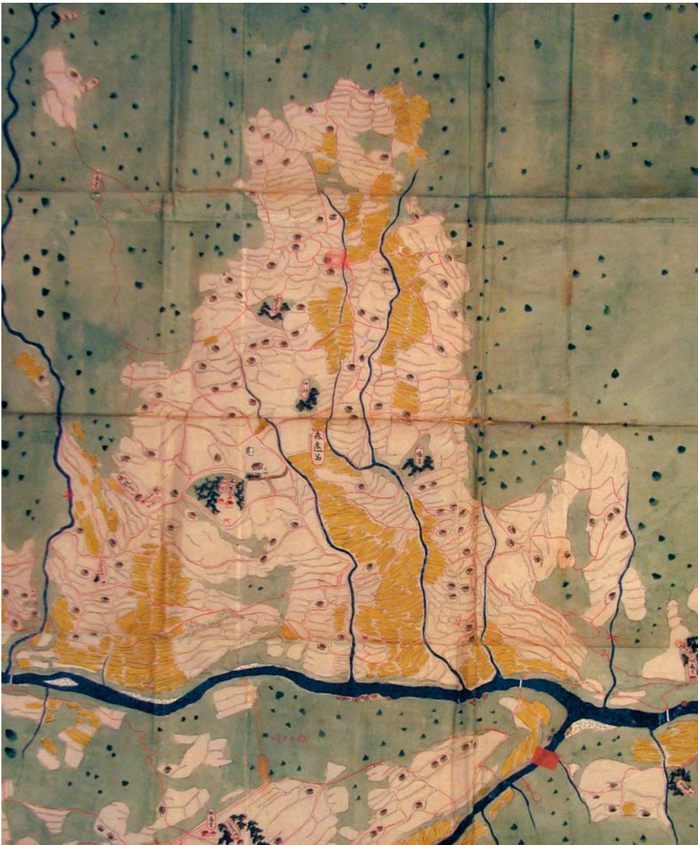
木屋平村分間絵図：川井村雨行大権現・大師ノ岩屋付近(上左)，剣山修験の霊場・藤ノ池本坊(上右)，森遠名(下)，本文172頁参照。