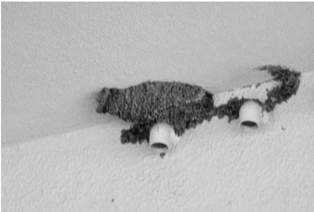
写真7 校舎底下のコシアカツバメの巣

ていない。その結果、溪流環境で観察された水辺の野鳥は種類数、個体数ともに少なかった。今回観察されたのは、サギ類では、ゴイサギ、ダイサギ(写真11)、アオサギの3種。群れは記録されず、営巣も確認できなかった。カモ類もオシドリ、マガモ、カルガモ(写真12)の3種、その中で、オシドリの比較的大きな群れが、コナラやアラカシなどの斜面林に接した川田川上流で記録された。これは、溪流に接した斜面林のコナラやアラカシなどが産する堅