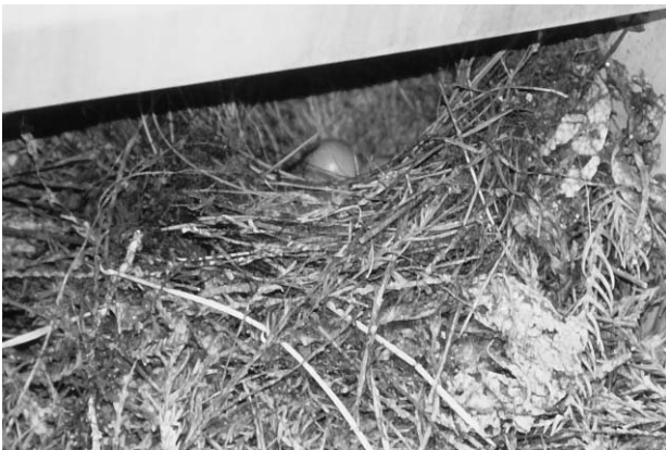
写真8 キセキレイの巣と卵