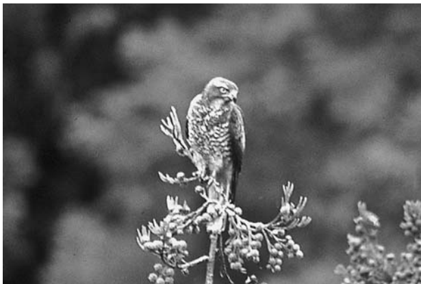
写真4 スギの梢にとまるサシバ

渡り個体の可能性もある。ヤマドリ（写真6）は、森林生息性の野鳥の中では大型の種であり、生態系の中で大型猛禽類や食肉性哺乳類にとって重要な餌動物である。村内では林道や林内で普通に生息していた。キバシリは、県内の生息数が少なく、大径木の林に依拠し生息地が限局的とされる留鳥である。阿波学会調査は、本種の県内生息分布情報の収集に大きく貢献している。美郷村でも月野のスギ林でその生息が確認された。