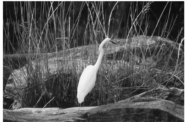
写真11 川辺に立つダイサギ