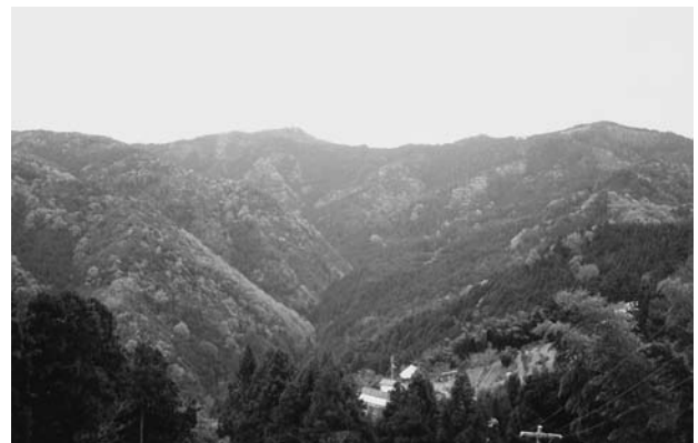
写真1 村東北部山地