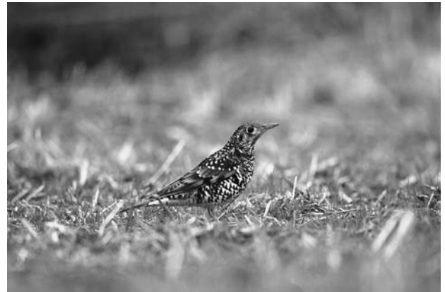
写真10 田で採餌するトラツグミ