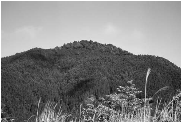
写真2 奥野々山南東面