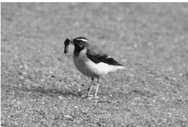
写真9 餌を運ぶキセキレイ雄