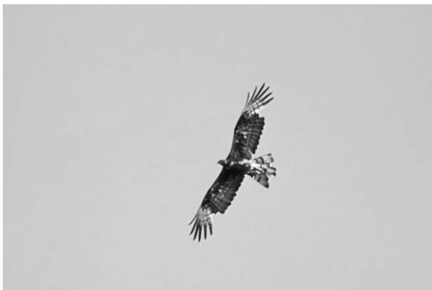
写真5 換羽中のハチクマ