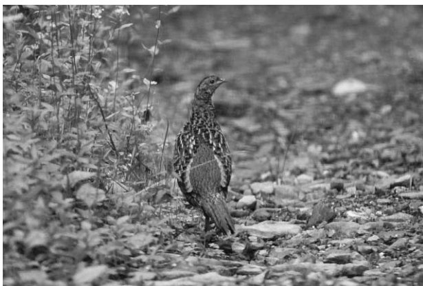
写真6 林道を歩くヤマドリ雌