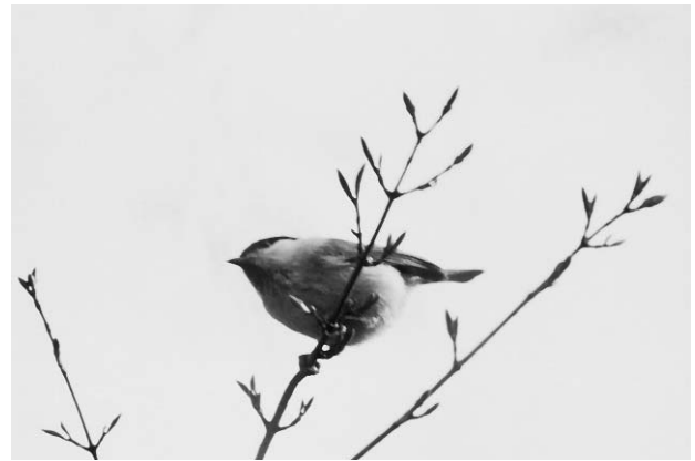
写真3 枝先で餌をさがすコガラ