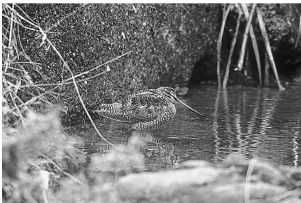
写真13 溪流にたたずむアオシギ

春に渡来し、日本各地の山林で繁殖した中型のタカ類のハチクマやサシバは、秋になると南の越冬地へ移動する。天候や地形など、飛行に好適な条件を選択する結果、「渡りルート」と呼ばれる、多数のタカが通過する経路が存在する。美郷村近隣の川島町掘割峠、山川町高越山、神山町松尾などでも比較的多数の渡り記録があることから、村内でのタカ渡りを確認する目的で、9月23日、28日の2日、村南西部の横山の尾根（標高約730m）で観察した。23日は悪天候のため十分な観察はできなかったが、28日には、8：20～15：20の間に、サシバ68羽、ハチクマ6羽、ノスリ1羽の渡りを記録した。そのほとんどは、山川町との境界の尾根上空を西に向かい飛去した。