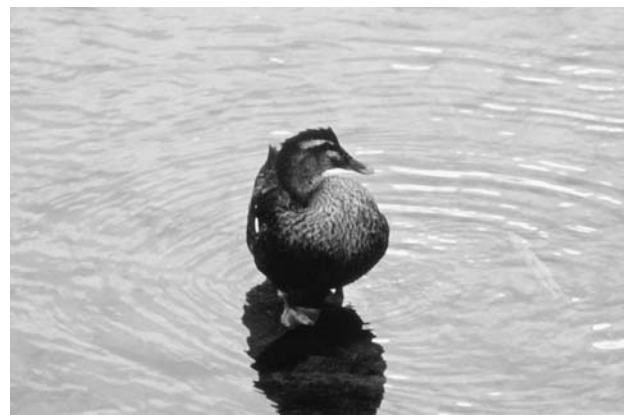
写真12 川の中に立つカルガモ