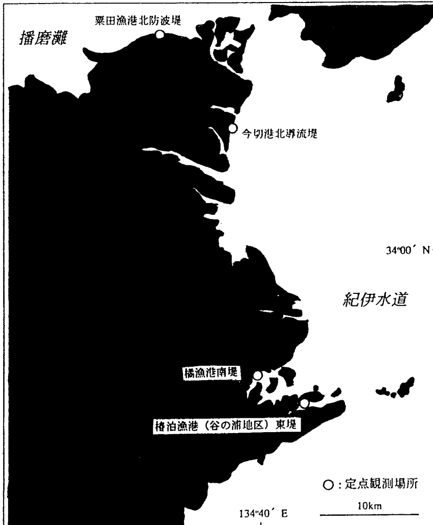
図1 水産指導員による定点観測地点図

水産指導員による地域定点観測を平成9年4月～平成10年3月の間の水温と比重を表わす。水温，比重の観測時刻は午前10時，比重は水温15の換算比重を示す。