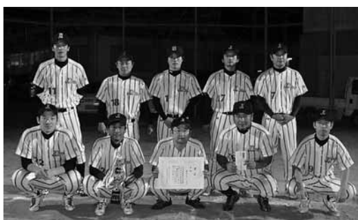
▶優勝した球友クラブチームの皆さん