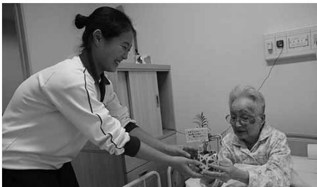
▶笑顔でプレゼントを手渡す生徒

9月18日、半田中学校全校生徒が特別養護老人ホームうらら荘を慰問に訪れました。生徒はグループごとに分かれ、部屋の窓ふきやぞうきんがけなどの清掃活動を行い、その後は「長生きしてください」などと生徒が書いた手紙を読んだり、歌やメッセージ付きの観葉植物がプレゼントされました。入所者はかわいらしい生徒の訪問に自然と笑みが溢れ、話をしたり、一緒に歌を歌ったりしていました。その後は、3階のホールに移動し、半中生のミニコンサートの開演です。各学年ごとにリコーダーの演奏と歌を披露し、元気いっぱいの中学生の音楽に、入所者は手拍子や拍手で応えていました。