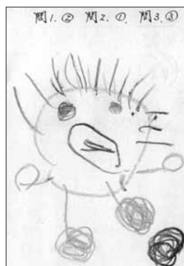
▶ペンネーム うさぎちゃん