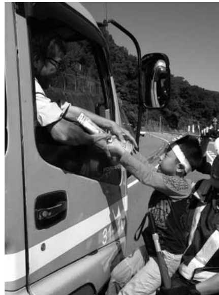
▶啓発チラシを手渡す園児

可愛らしい園児たちの呼びかけにドライバーらも「気をつけて運転します。」と笑顔で応えていました。