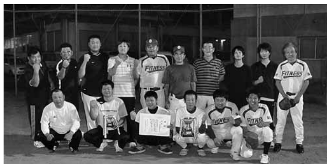
▶優勝した坂外地区のみなさん

9月30日(月)～10月9日(水)まで、平成25年度つるぎ町ソフトボール大会が貞光中学校グラウンドで開催されました。試合は、各地区で結成された7チームが参加し、トーナメント戦を行いました。1回戦から好ゲームが続くなか、決勝戦に勝ち進んだのは坂外地区チームと太田地区チームとなりました。坂外地区チームが16-5で太田地区チームをくだし、見事優勝しました。選手の皆様お疲れ様でした。