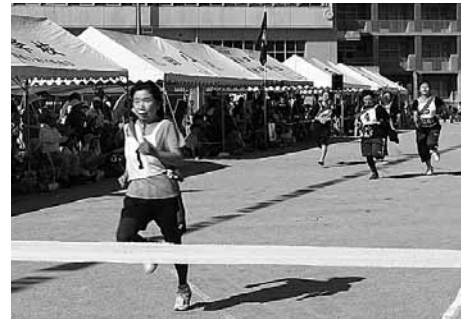
▶白熱した女子二百メートルリレー

しました。新しく競技に加わった一般の三輪車競争では普段乗り 慣れない三輪車に悪戦苦闘しながらも抜きつ抜かれつの白熱 した熱戦が繰り広げられました。またボーリング競争ではなか なか倒れないピンを一度に倒す方もいて、大いに盛り上がりまし た。また、交通安全防犯パレードには交通安全母の会、つるぎ警 察署の皆さんが交通安全を呼びかけました。13種目の得点競 技で競い合った結果、今年は第9区(太田地区)が優勝し、第7区 (町北地区)が準優勝に輝きました。爽やかな汗を流し、スポー ツの秋を満喫した1日になりました。