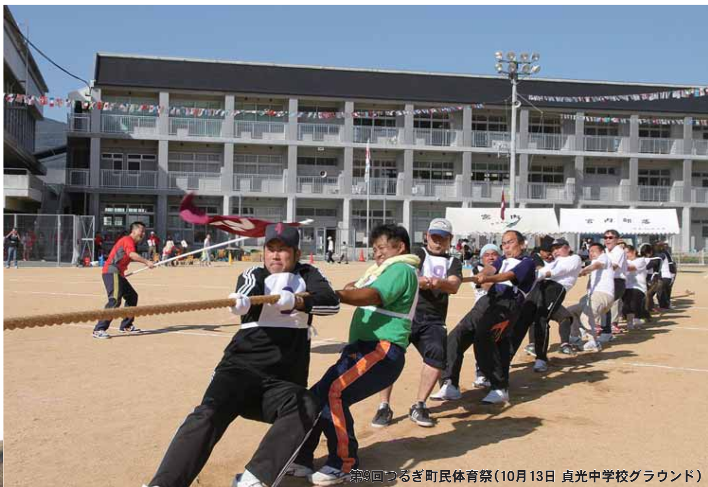
第9回つるぎ町民体育祭(10月13日 貞光中学校グラウンド)