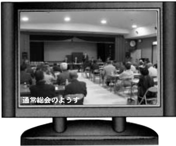
通常総会のようす