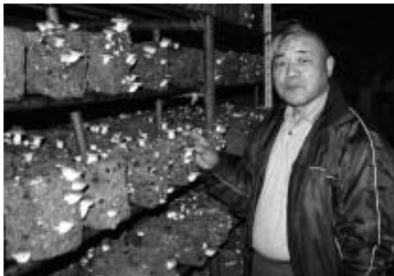
▶菌床ブロックでしいたけを栽培してみませんか

釣り竿を持たせ、魚がかかると少々待ちます。小さな魚から大きな魚…いろいろな魚がかかります。その時の子供の笑顔は何ともいえません。こうして寒いながらも我が家では毎日を過ごしています。子どもたちも日々のびのびと大きくなっているのがよく分かります。親としてすごく幸せなことです。子どもには、いつもありがとと思つ気持ちを持たされます。