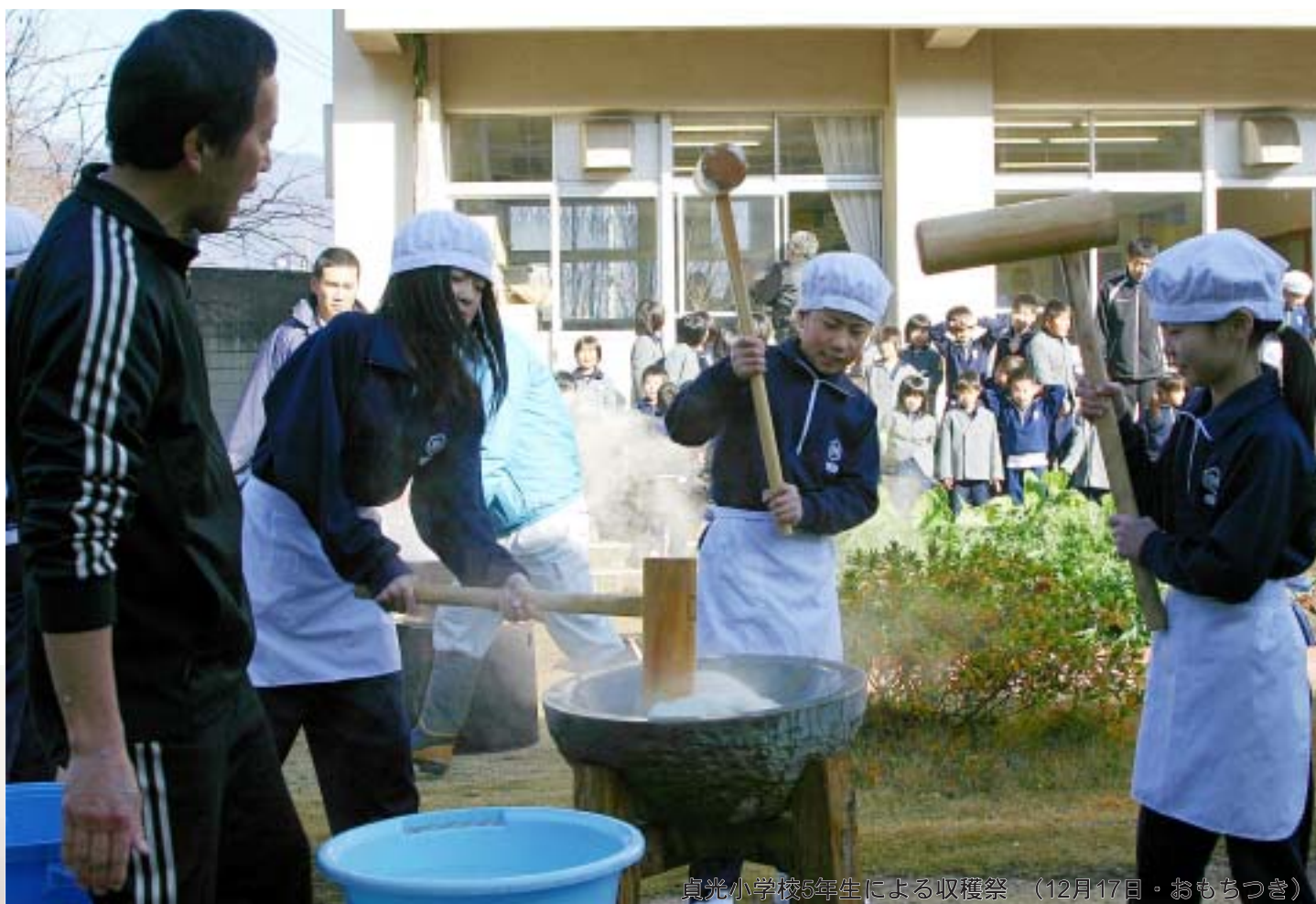
貞光小学校5年生による収穫祭 (12月17日・おもちつき)