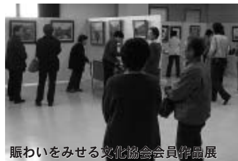
賑わいをみせる文化協会会員作品展

民舞・舞踊・コーラス・童謡・大正琴・カラオケ等各会員が、日ごろの成果を正装して艶やかに楽しく披露しました。舞踊では、日本舞踊の古典的な舞を限られた時間に表現し、カラオケでは、旅がらすの格好をして歌うと会場からは拍手喝采を浴びました。