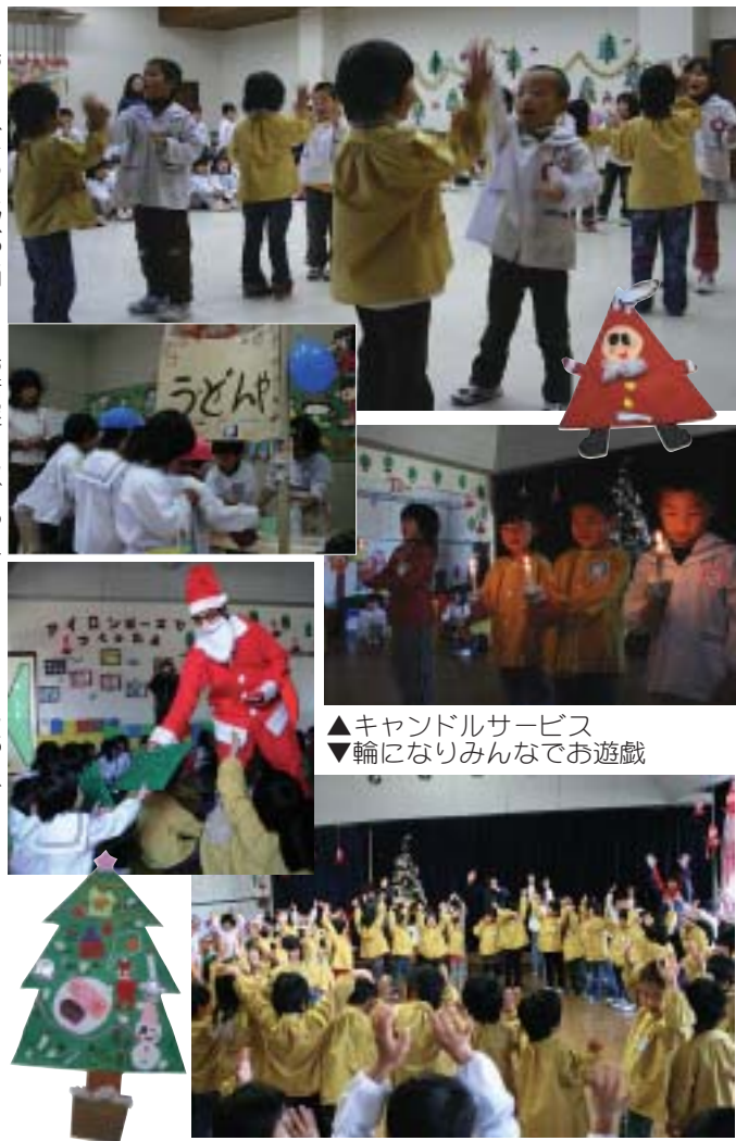
▲キャンドルサービス ▼輪になりみんなで遊戯

また10日には貞光・古見幼稚園交流クリスマス会が貞光幼稚園で行われました。はじめにクリスマスにちなんだ絵本「静かな夜に」の朗読を、子どもたちは挿絵を眺めながら聴きっていました。輪になり、赤鼻のトナカイなどお友達と手をつなぎダンスを楽しみ、キャンドルサービスなどでサンタさんを待ちました。このあと、「サンタさん」と大きな声で呼ぶと、サンタさんが貞光幼稚園にやってきました。ここでも大人気のサンタさん。子どもたちにプレゼントを渡し、グリーンランド出身のサンタさんに、子どもたちから「好きな動物は？」などの質問を先生が通訳すると、質問に笑顔で答え、一足早いクリスマスをみんなで楽しみました。