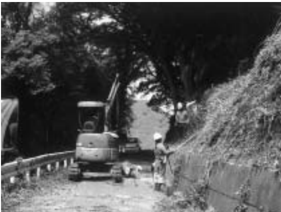
▶町道脇の刈り込み作業を行う宮内・白村・岡集落の皆さん

宮内・白村・岡集落では、中山間直接支払制度を利用して、町道であり集落道でもある道路脇の草や小枝、大きくせり出した木などの刈り込み作業を、七月中旬から八月上旬にかけて行いました。これは、木が繁っているためにカーブ見通しの悪い箇所や、日光が当たらず薄暗く危険な箇所などを重点的に、宮内から白村までの二〇〇〇メートルを超える道路を、所有者の方に許可をいただき作業を行いました。