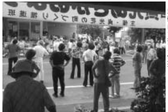
▲朝顔の咲くすがすがしい早朝にラジオ体操