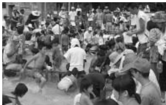
◀ 一字のふるさとまつりで賑わいをみせるアメゴやマスのつかみ取り

8月13日、一字公民館前では一字ふるさとまつり(同実行委員会・つるぎ町主催)が盛大に開催されました。古見小学校のプールでは、アメゴやマスのつかみ取りが行われ、小学生以下の子どもたちがプールに入り、群れて泳ぐ魚影を追いかけ、服を濡らしながら魚を手で捕まえていました。また、一字公民館前特設ステージに訪れたお客さんや帰省客らは、焼き鳥・田楽などで舌鼓をうちながら、懐かしのフォークソングに耳を傾け、阿波踊り・大道芸・カラオケ大会などで盛り上がりました。また、公民館内では、つるぎ町の巨樹写真も展示され、巨樹・巨木の持つ雰囲気が見入る写真に見入り、ふるさとが誇る自然のすばらしさを改めて感じていました。