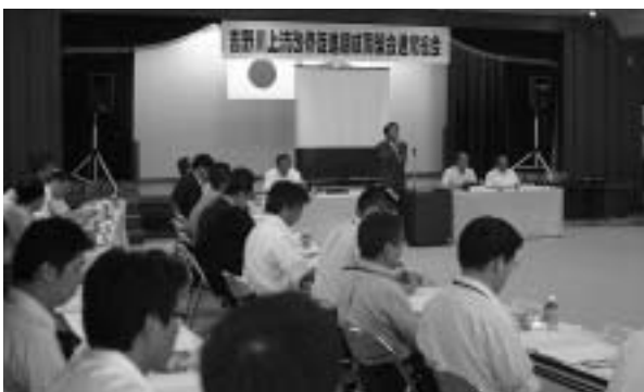
▲吉野川上流改修促進期成同盟会通常総会の様子