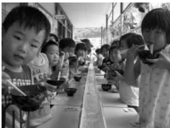
そうめんとおむすびを食べ、半田幼稚園の夏まつりを満喫していました。

7月15日、半田幼稚園で夏まつりが開かれました。子どもたちは、各イベントに参加するための券を手に持ち、園内のヨーヨーすくい、金魚すくい、お菓子屋さんなどを巡り楽しみました。体育館に移動し、年長さんと年少さんに分かれて阿波踊りを踊り、夏の雰囲気を味わいました。お母さん方の手伝いによりご飯の準備が出来たので、踊り疲れた子どもたちは、青竹の上を流れる冷たく美味しい流し