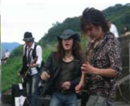
▲C'zのコンサートのようす