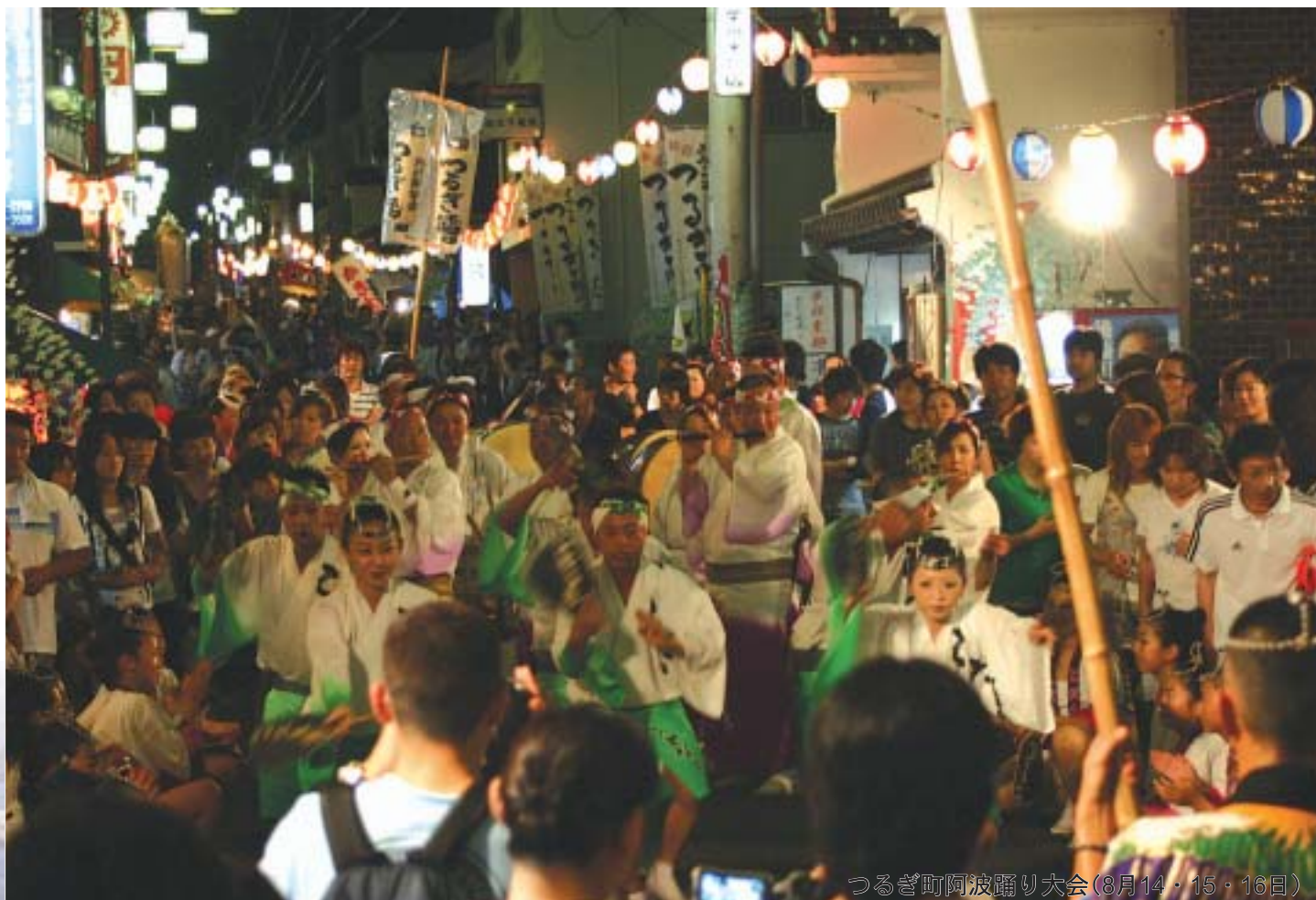
つるぎ町阿波踊り大会(8月14・15・16日)