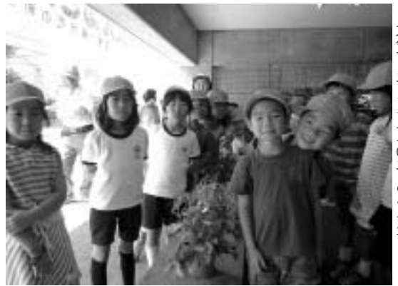
▲朝顔の観賞に訪れた元気っ子クラブの子どもたち