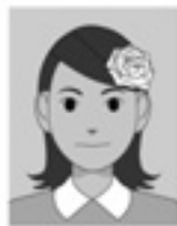
顔や顔の輪郭が隠れる装飾品などがある