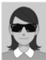
サングラスをかけ人物を特定できない