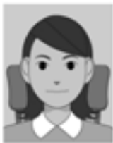
椅子などの背景がある