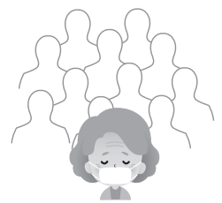
無用に入混みに入らない