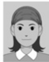
幅の広いヘアバンドなどにより顔の一部が隠れている