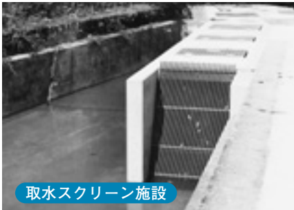
取水スクリーン施設

水車の運転状況は良好で、発電実績として平均で32kw(10/13~10/27)の発電を行っています。