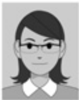
眼鏡のフレームが目にかかっている