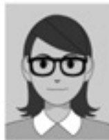
フレームが非常に太く目や顔を覆う面積が大きい