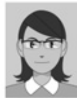
照明が眼鏡に反射している