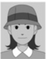
帽子によって顔の一部が隠れている