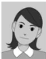
顔が左右に傾いている