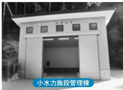
小水力施設管理棟