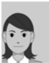
顔の位置が片寄っている