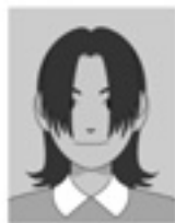
前髪が長すぎて目元が見えない/顔の輪郭が隠れる