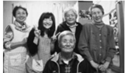
第3回みどりなパーティー♪