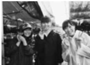
椎茸が「好き」から「大好き」になったそうです！