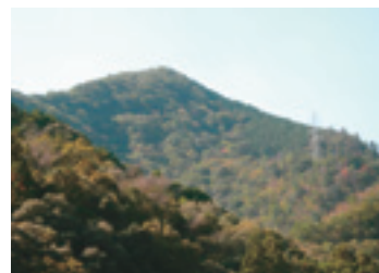
負出山(園瀬川より)

峠は少し広がって、数台駐車可能だ。さてここで一息入れる。取り付きは村道の法面を上がる。雑木の中を標高差で120m程、赤テープを追いながら直