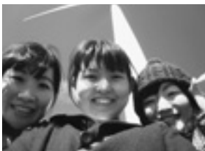
大川原高原！風車が入らな～い(笑)