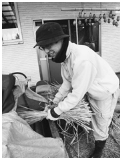
脱穀作業中 最終工程へ

いろいろ書き連ねましたが、いつもみなさんのご理解とご協力に感謝しています。今年もよろしくお祈い申し上げます。