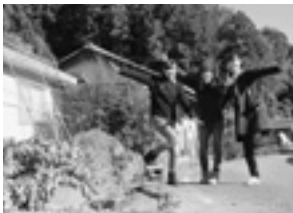
お家の前でパシャリ♪