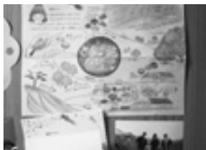
後日手紙をもらいました☆