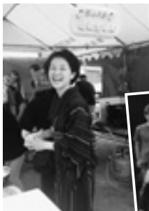
夏祭りは嵯峨野小町として参加しました