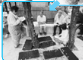
メモを片手に…みんな真剣です