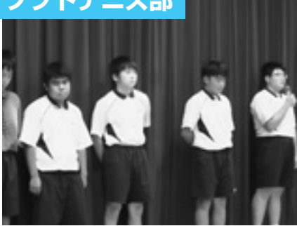
団体戦 佐那河内中 1 - 2 井川中