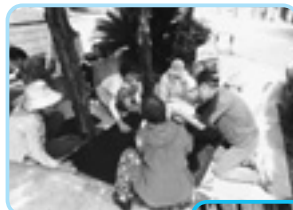
トレーに土を入れて、鎮圧…みんなで協力して

植えること6品目、128粒。冬においしい野菜がとれますように。 (リポーター：宗像)