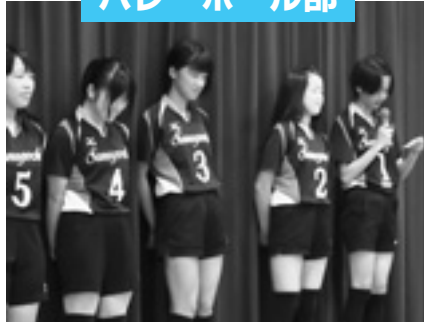
1回戦 佐那河内中 0 - 2 坂野・立江中