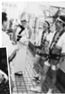
協力隊3人ですだち連!!