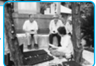
さすが野菜づくりのプロ…説得力十分