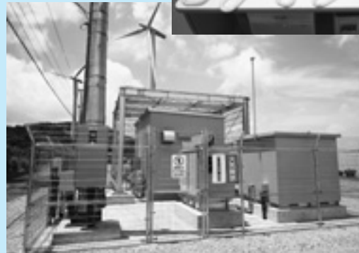
大川原高原前進基地局