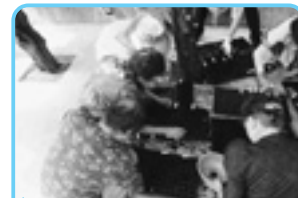
1粒ずつ、種まき中…こまいなあ