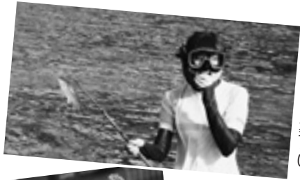
船のついでに楽こぎ〜!

この度、村内で始まった古民家アートプロジェクトの広報担当に就任いたしました。別紙の『お月見処通信』もぜひご覧ください!!