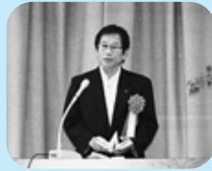
床桜危機管理部長