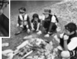
焚火を囲んでみんなでおしゃべりしました