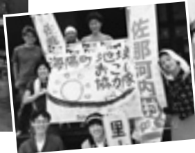
すだちくんダンス撮影後の記念撮影♪