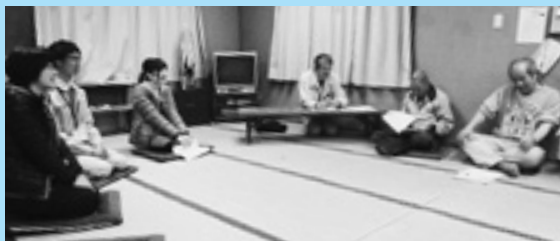
中分常会にて団らん

各集会所などで開催される常会にごあいさつに伺っています。初めの方は固かった私たちでしたが、皆さんのなごやかな雰囲気になんか緊張がやわらいでいます。