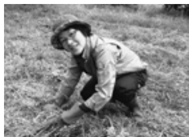
まるこガーデン整備中

今後の活動としては、自然やアウトドアを通じ佐那河内村の資源を生かした地域おこしで、人と人をつなぐ活動を行っていきます。そして私自身も自然と田舎の生活を満喫したいと思います。活動中でもマラソンの練習中でも遠慮なく声を掛けてくださいね。