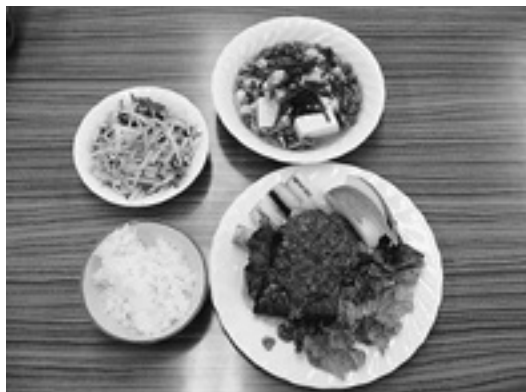
健康料理教室では、塩分を控えた調理や味付けの仕方を学んでいます。

地域包括支援センターでは、明るく健やかな生活が続けられるように介護予防教室を開催しています。楽しく身体を動かしたり交流を楽しみましょう。皆さまの参加をお待ちしています。