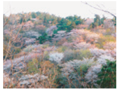
夕日に映える山桜