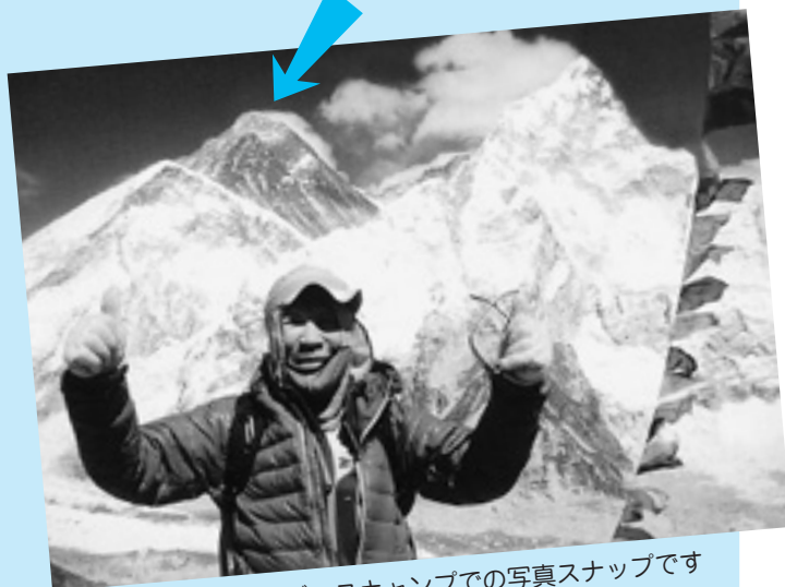
エベレスト ベースキャンプでの写真スナップです