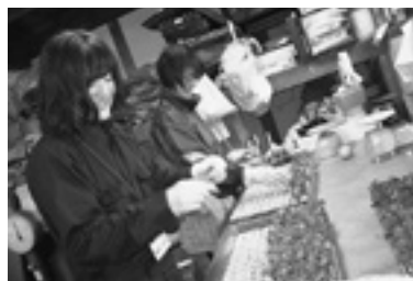
なれるのに時間がかかった キクの挿し芽作業

好きなことは音楽鑑賞と書道、あと高校時代から野球部のマネージャーをしていたので、野球の話になると少しだけ熱くなります(笑)あとは、いろいろな道の駅に行くことが好きで、行くとワクワクがとまりません!