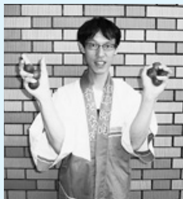
やっぱりスタチはやめられない！

来年こそは、踊る阿呆。今年感じた身体の叫びを解消し、踊り手に抱いた憧れを現実に塗りかえます。身構えることなく練習に出向くとしましょう。皆さんも一緒に踊りませんか。にぎわいと観衆の視線、そして何よりも踊ることの面白さ、きっと楽しいことでしょう。最後に、熱演した佐那河内すだち連の皆さんと街角で大人気だったすだちくん、お疲れさまでした。（宗像）