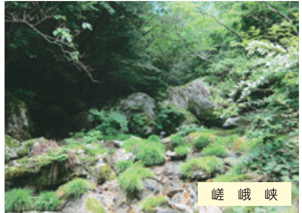
嵯 峨 峡