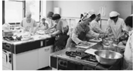
8月の料理教室では厚揚げの南蛮漬けやゴーヤのサラダを作りました。

地域包括支援センターでは、明るく健やかな生活が続けられるように介護予防教室を開催しています。楽しく身体を動かしたり交流を楽しみましょう。皆さまの参加をお待ちしています。