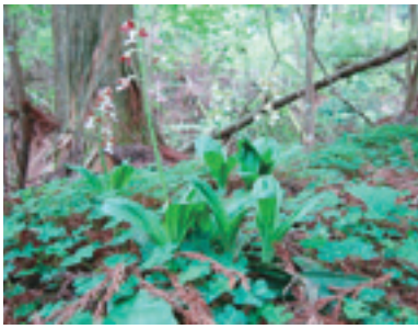
盗掘被害にあったラン科エビネ

しかし、7月下旬に悲しい事件が起きました。ネイチャーセンター周辺に咲いていたラン科エビネ（徳島県版レッドデータブック絶滅危惧Ⅱ類、環境省版レッドデータブック準絶滅危惧種）が盗掘されました。誰が犯人なのかは分かりませんが、きちんと記録を取り、警察にも相談しました。