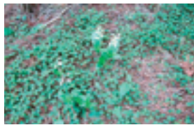
盗掘前(2012年5月29日)の状態。5~6株が咲いている。

探った人は「自分ひとりくらいが採っても大丈夫だろう」「綺麗な花だな、家の花瓶にいけないな」そんな軽い気持ちで盗掘された。しかし、例えこのような理由であつても他人の敷地内に生えているものを