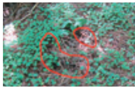
盗掘直後(2012年7月24日)の状態。1株しか残っていない。

「勝手に」取れば、これは明らかな犯罪「窃盗」です。今後、盗掘防止のために希少種保全活動団体や関係機関と連携し、どうしても盗掘が防げるか意見交換の場を持ちたいと考えていますので、同じようにお困りの人や情報をお持ちの人はご連絡ください。(田代)