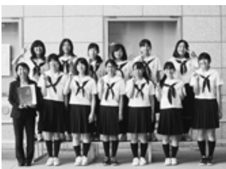
四国合唱コンクール出演後 高知市文化プラザかるぼーと前にて

7月23日に行われた第65回全日本合唱コンクール徳島県大会では「Agnus Dei(神の子羊)」「Lauda Sion(シオンよ、汝の救い主をたたえよ)」の2曲を美しい歌声で演奏し、みごと金賞に輝きました。そして9月1日、高知市文化プラザかるぼーとで行われた四国合唱コンクールに徳島県代表として出場し、銀賞を受賞することができました。