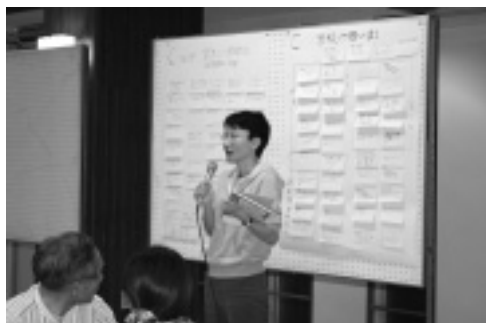
ワークショップでの風景

佐那河内小中学校の改築にあたり、村民の皆様より貴重なご意見をいただく場として7月より3回にわたりワークショップを開催してきました。