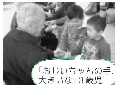
「おじいちゃんの手、大きいな」3歳児

村内の保育所児童や小中学生らと独居老人が相互訪問し、親睦を深めることも行事の1つです。