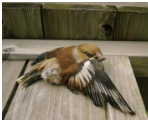
何かに激突し落鳥したシメ

何の罪もない生物を私たちの貪婪で亡き者にし、「そんなの関係ねえ」と邪険にするのは、人間の傲慢です。そうではなく、私たちみんなが「現代のコペルニクス」でありたいものです。(吉田) ※環境まちづくりシンポジウム・特別講演から