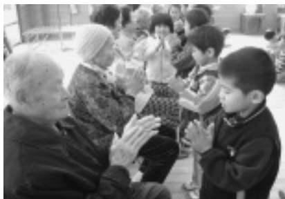
♪〈茶摘みの手遊び 5歳児〉