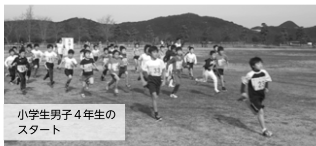
小学生男子4年生の スタート

2月14日(日)、鳴門ウチノ海総合公園で第43回鳴門クロスカントリー大会が行われました。市内外から372人、最年少は8歳、最年長は80歳と幅広い年齢層の方が参加し、互いの健脚を競いながら気持ちの良い汗を流していました。