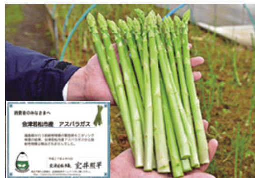
特産物のアスパラガス。放射性物質が検出されていないことを示すチラシで安全・安心を提供している

観光では各種メディアを活用した広報や周知、物産展の開催に力を入れたほか、旅行代理店を積極的に訪問し誘客依頼を行いました。農業では福島県と連携し、野菜・果物・山菜・食肉など全ての農産物の放射性物質モニタリング検査と米の全量全袋検査を実施。検査結果は生産者や流通業者、消費者