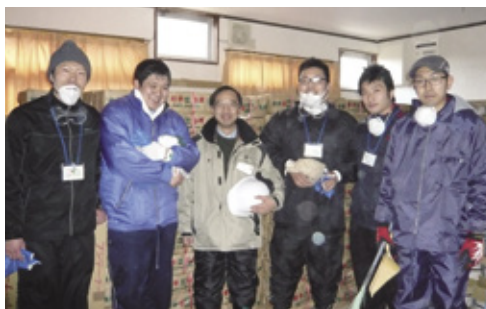
仕事の創出を支援。「カキ小屋」建設のために、大量の木炭や七輪を運んだ=石巻市

で互いに助け合う『共助』を考えておく。例えば避難所でどう生活するか、何に配慮すべきか、災害が起きる前に知っておくべきです。『我先に』とならない助け合う文化。他者を思いやる心をはぐくみたい」と警鐘を鳴らします。東北の春は寒く、冷たい風が吹き荒れるそうです。今月、藤村さんらは再度宮城の被災地に向かいます。