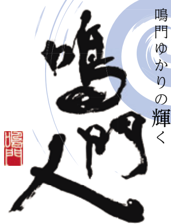
鳴門ゆかりの輝く

には「5段位」に昇進。その後「勉強し直して」、ネット碁最高の「9段位」へと上り詰めました。県内の囲碁名人が競う大会の常連。囲碁愛好家の中でも「乱戦に強い勝負師」と評判です。持ち前の粘りに加え、「自由に打ちたいように打つてます」と言っている自信が、周囲にそう言わせるのでしょう。対局では心理戦もあるのでは、と問うと「顔色