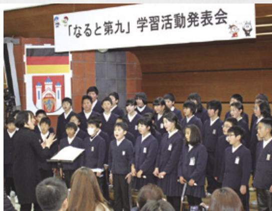
元気いっぱいの声で「第九初演物語」を歌っていました

発表は3校を代表して林崎小学校が実施。学習の取り組み状況を同校教諭が報告した後、同校5年生60人が、第九が演奏されるまでの過程を描いた「第九初演物語」を歌や演奏、語りで披露しました。最後には、「歓喜の歌」をドイツ語で元気いっぱいに歌い、会場内からは大きな拍手が送られました。