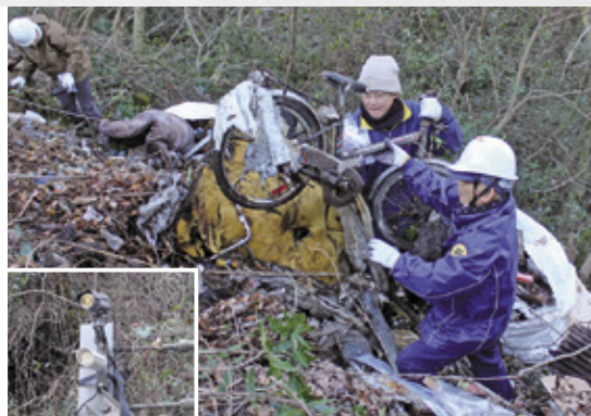
写真①：急斜面で不法投棄物の撤去に励む参加者ら 写真②：設置された監視カメラ

参加者らは、小さな空き缶からマットレスや自転車といった大きなものまで、約8.1トンのごみを回収。また、県が不法投棄を未然に防止し、抑止効果の向上を図ろうと監視カメラを設置しました。同協議会は、美しい自然環境を未来へ継承するために、今後も引き続き活動を行います。