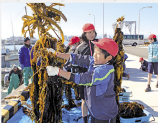
大きく成長した鳴門わかめを刈り取る児童たち