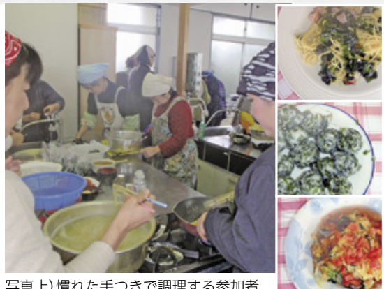
写真上) 慣れた手つきで調理する参加者 写真右) 上からペペロンチーノ、つみれ、トマトあんかけ

この教室は鳴門わかめの消費拡大につなげようと、市と同漁協が平成22年から毎年開催し、今回で5回目。参加者は同漁協女性部の協力の下、「ペペロンチーノ」や「ワカメのつみれ」などのレシピに挑戦。できあがった料理はみんなで試食し、ワカメの色や香り、食感を堪能していました。