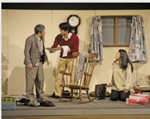
訪問販売で多額の不要物を購入した事例を紹介