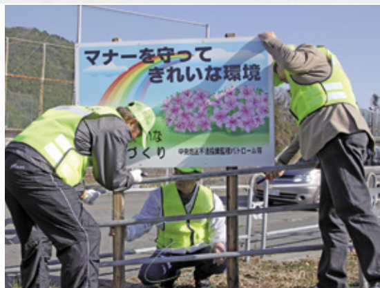
環境美化を呼びかける看板を手作業で設置する隊員

式後、新池川沿いに環境美化啓発看板を設置。不法投棄のないきれいなまちづくりを目指し、パトロールや啓発に努めることを誓いました。本市では平成17年の板東地区を皮切りに次々と隊が結成され、今回で11地区となりました。