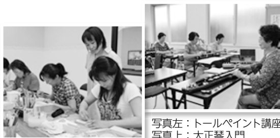
写真左：トールペイント講座 写真上：大正琴入門