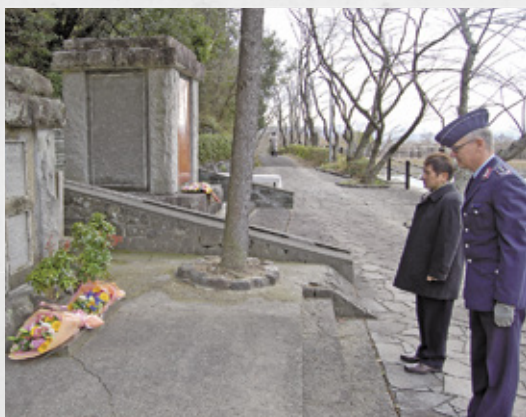
慰霊碑前に献花するブッシュ大佐と泉市長