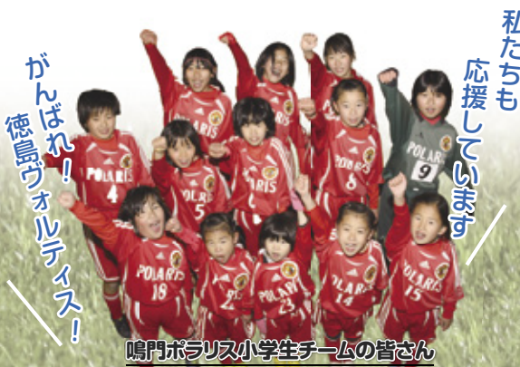
鳴門ポリリス小学生チームの皆さん

3月8日の臨時駐車場はウチノ海総合公園とポートルース鳴門の2カ所です。なお、臨時駐車場は試合日によって変わることがあるため、試合ごとにヴォルティスHPなどでご確認ください。