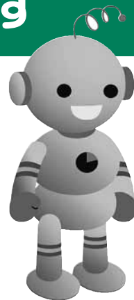
工業統計キャラクター コウちゃん