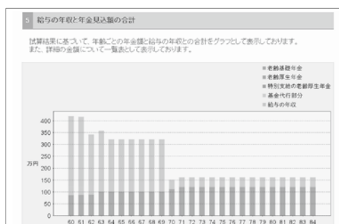
年金見込額試算画面