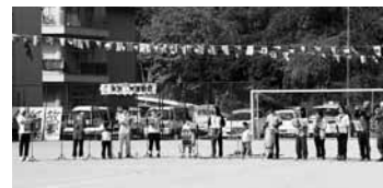
住民有志+インターン生+協力隊の金管バンド!!

初めての地区運動会に、金管/杉の娘校でのイベント出演までしてしまいました。普段出会う機会の少ない子育て世代/出身者に協力隊を広くPR出来たら幸いです。