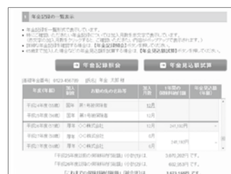
年金記録の一覧表示画面