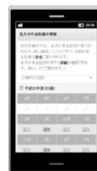
年金記録照会画面