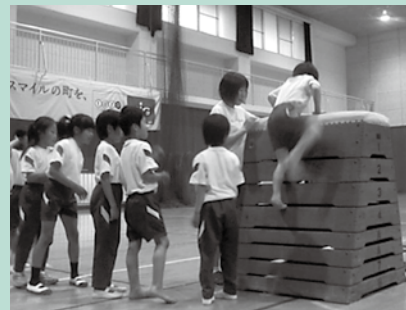
跳び箱をよじ登っています。色々な道具を使って、多様な動きを経験することで、神経のネットワークが構築されます。

☆各教室に参加をご希望の方は、2日前までに電話かファックスにてお申し込みください。 ☆対象は指定がない限り全年齢対象です。ただし、5歳未満のお子様は保護者同伴でご参加ください。