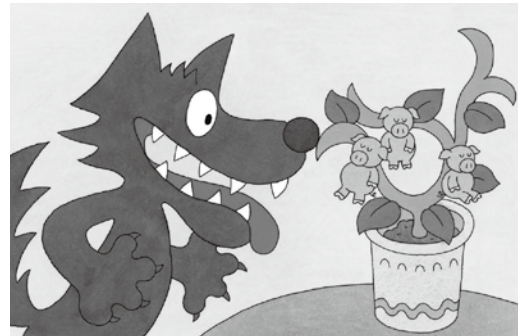
絵本「またふたのたね」2005年 © 佐々木マキ

学生時代からマンガ家として注目され、漫画雑誌「ガロ」などで独自のマンガ作品を発表していた佐々木マキは、1973年に絵本『やっぱりおおかみ』で絵本作家としてデビューしました。その後『ムッシュ・ムニエルをごしょうかいします』、『ねむいねむいねずみ』など数多くの絵本を発表し、絵本作家として活躍する一方で、村上春樹らの小説の挿絵を描くなど、幅広い年代に親しまれてきました。