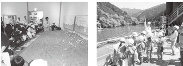
ダム見学会の様子

皆さんこんにちは。国土交通省 那賀川河川事務所です。今回は「森と湖に親しむ旬間」と「那賀川の日」のご案内です。