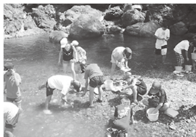
水生生物調査の様子