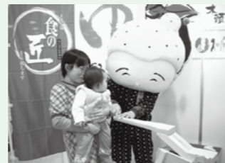
ゆずばあちゃんと柚子しぼり。