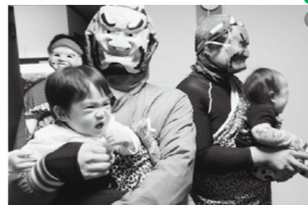
「いい子にするから、はなして〜!!」