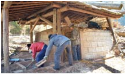
窯に火入れをし、1週間待ちます。この窯で月約250kgの炭が生産されています。