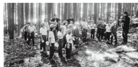
【中内集落への徒歩遠足】 太刀踊りのルーツをたずねて、全員で行きました。昔の暮らしについても学習しました。

木頭小学校の全校児童数は、現在25名です。みんな仲よく、元気に過ごしています。毎朝の木頭リズム体操で、心や体をほぐして一日がスタートします。一本乗りや木頭柚子など木頭の自然や文化、特産物について、地域の方に教えていただく機会を設けています。自分たちが生活する木頭について学ぶことで、郷土に対する思いを深めています。 小中施設一体校として、中学生と一緒に新校舎で学んでいます。運動会や文化祭などの行事を共に行うことで、刺激を受けると同時に、身近な目標にもなっています。