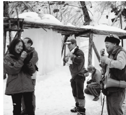
大氷柱にテンションがあがります。

2月2日(土)に開催された四季美谷温泉主催の樹氷まつり。この日は晴天、高温のため残念ながら樹氷は見られませんでした。町内外から参加した87名は、木沢の雪山を楽しみました。