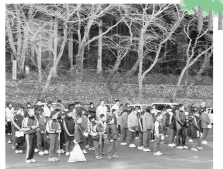
11チームの参加があり、この日2つの大会新記録が出ました。

2月3日(日)に那賀町子ども会相生支部主催の那賀町親子駅伝大会が開催されました。晴天にも恵まれ元気いっぱいタスキを繋ぎました。