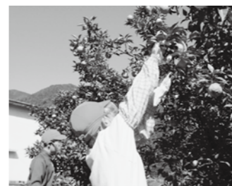
【柚子の収穫体験】 地域の方の協力を得て、収穫から柚子搾りまで体験させていただきました。

木頭小学校の全校児童数は、現在25名です。みんな仲よく、元気に過ごしています。毎朝の木頭リズム体操で、心や体をほぐして一日がスタートします。一本乗りや木頭柚子など木頭の自然や文化、特産物について、地域の方に教えていただく機会を設けています。自分たちが生活する木頭について学ぶことで、郷土に対する思いを深めています。 小中施設一体校として、中学生と一緒に新校舎で学んでいます。運動会や文化祭などの行事を共に行うことで、刺激を受けると同時に、身近な目標にもなっています。