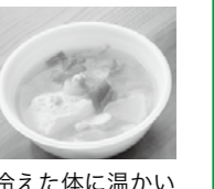
冷えた体に温かい豚汁をどうぞ。