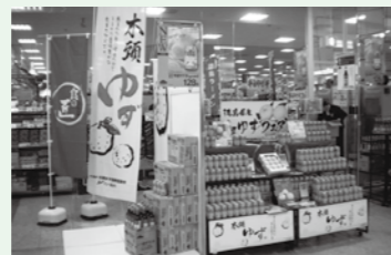
きれいに並んだ木頭ゆず缶耐ハイ!