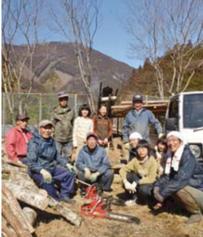
『おららの炭小屋』と『結遊館』のみなさん。