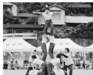
【木頭保・小・中合同運動会】 お互いに声援を送り合う中から、つながりが深まっています。