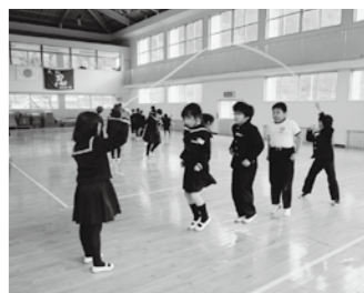
【休み時間の長縄跳び】 全校でドッジボールなどもする中から、相互に尊重し合う心も育っています。