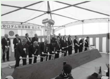
はつぐわ、くす玉開披