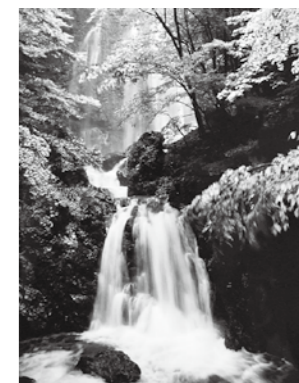
「新緑の風」 田村憲功

町内の皆様から寄せられた絵画と写真で、那賀町の魅力を紹介する展覧会です。ふるさとの豊かな自然とともに育まれてきた情景や人々の暮らし、魅力あふれる私たちの町をどうぞご覧ください。