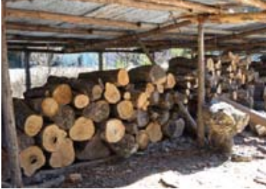
炭焼きのための木材は、土砂災害や道路改良工事等で出たものを譲り受けることもあるそうです。