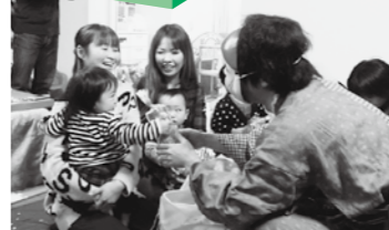
泣いた後には福の神からプレゼント。

2月3日(日)の節分に、毎年恒例のなかはげ(那賀町鶯敷青年団主催)が申込のあった家庭へ鬼出張をしました。泣き叫ぶ子どもたちは頑張って鬼退治をし、最後に福の神からお菓子のプレゼントをもらいました。