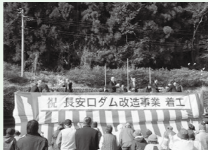
期成同盟会主催のもち投げ