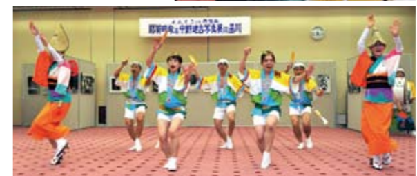
「那賀町物産展」那賀町選りすぐりの特産品を東京まで搬送し、来場の皆さんに販売しました。また柚子絞りコーナーも設け、会場に懐かしい故郷の香りもお届けしました。