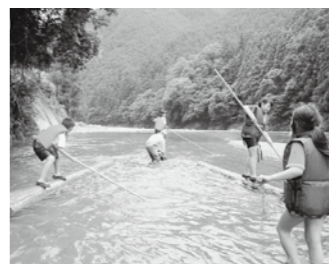
【一本乗り体験】 保存会の方の協力を得て、5・6年生が参加しています。バランスよく乗れています。