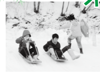
そりすべりは本当に楽しい!

1月26日(土)にファガスの森周辺にて「那賀町子ども会オリエンテーリング大会」が開催されました。インフルエンザの流行もあり、参加できない子どもたちもたくさんいましたが、この日参加した親子15名は、町内で雪遊びができるとあって、寒さも忘れ、そりすべりなどの雪遊びを楽しみました。