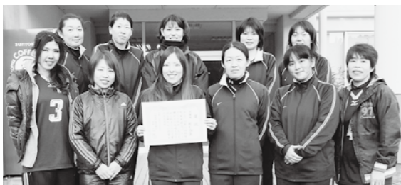
相生体協チームのみなさん