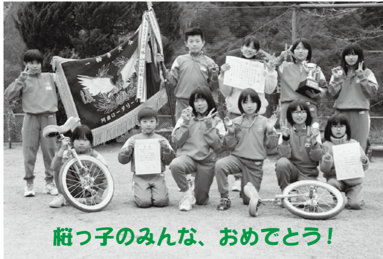
桜っ子のみんな、おめでとう！