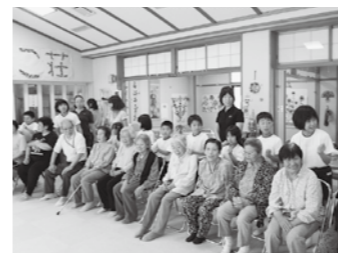
年3回の「やまびこ荘訪問」。高齢者の方々は児童との交流をいつも楽しみにしてくれています。

明るく元気な杉の子達は、みんな力を合わせ楽しく学校生活を送っています。 本年度の重点目標である学力向上に向け、放課後の時間を活用した「杉の子GOGOタイム」、親子読書をすすめる家庭読書週間も始めました。また体力面でも、朝の運動時間を確保し、全校体育では、一人一人が目標を持って取り組むことにより、確実に体力が向上してきました。 また「国際交流集会」、「やまびこ荘訪問」、他校との交流学習、地域交流などを数多く行い、教室だけでは学ぶことのできない豊かな体験を重ねました。杉の子達は、様々な交流を通して、人前で自分を堂々と伝えることのできる表現力、様々な立場の人のことを考えられる思いやりの心などが育つてきました。家庭や地域の温かい愛情に包まれて、ますます育っている杉の子達は、黒滝山の木のようにまっすぐ伸びています。