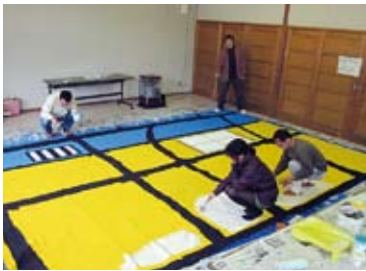
舞台背景や小道具もすべて手作りです。