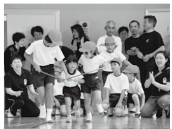
雨天の為、体育館で行った木沢運動会。堂々の演技を披露した児童に地域の方々から熱い拍手が送られました。