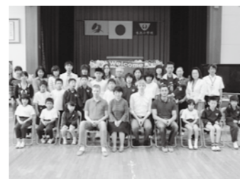
今年で18回目の「国際交流集会」。今年はドイツと中国の方と楽しいひとときを過ごしました。

明るく元気な杉の子達は、みんな力を合わせ楽しく学校生活を送っています。 本年度の重点目標である学力向上に向け、放課後の時間を活用した「杉の子GOGOタイム」、親子読書をすすめる家庭読書週間も始めました。また体力面でも、朝の運動時間を確保し、全校体育では、一人一人が目標を持って取り組むことにより、確実に体力が向上してきました。 また「国際交流集会」、「やまびこ荘訪問」、他校との交流学習、地域交流などを数多く行い、教室だけでは学ぶことのできない豊かな体験を重ねました。杉の子達は、様々な交流を通して、人前で自分を堂々と伝えることのできる表現力、様々な立場の人のことを考えられる思いやりの心などが育つてきました。家庭や地域の温かい愛情に包まれて、ますます育っている杉の子達は、黒滝山の木のようにまっすぐ伸びています。