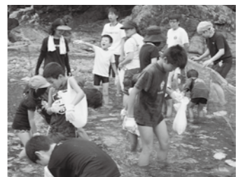
「とったぞー！」保護者の提案で実現した、デイキャンプでの楽しいアメゴつかみの様子です。