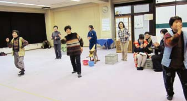
1月12日に東京品川で開催された「もんてこい丹生谷那賀町祭」ミュージカル公演に向けての練習風景。