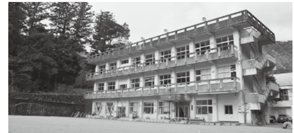
昭和48年4月に坂州小学校と沢谷小学校が統合し、木沢小学校が誕生しました。今春、創立40周年を迎えます。

木沢小学校校歌 (作詞)森吉 芳 (作曲)山橋正和 一、ああ高丸の霧晴れて 輝きわたる 朝風に おどる杉苗 杉の子は 村の希望のしるしです 杉の子杉の子 胸はつて 集まる集まる木沢小学校 二、アメゴはねとぶ谷こえて 小鳥も なかよく歌うてる 山は友だち山びこは 赤いもみじに響きます 山びこ山びこ 呼びあつて 楽しい楽しい木沢小学校 三、黒滝山の木は 風にも雪にも 負けぬよう 土にしつかり根をはって 青いお空にそびえてる 風の子雪の子 たくましく 頑張る頑張る木沢小学校 四、山なみ遠く那賀川の 水がわきでる この村のほまれたたえ山の子は 力いっぱい進みます 山の山の子 手をつなぎ 伸びゆく伸びゆく木沢小学校