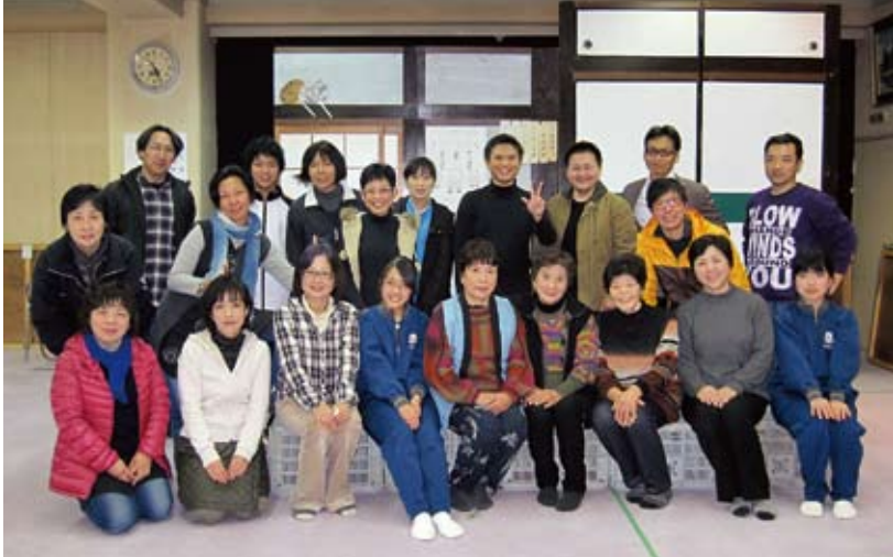
『もんてこい劇団』のみなさん（平成21年に結成）。