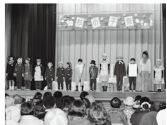
児童だけでなく、地域の方も出演出品して下さる「杉の子祭」は、参加者全員が一体となって盛り上げます。