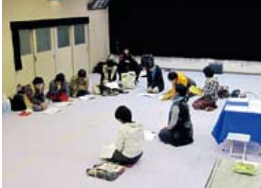
本読みのようす。みなさん真剣です。