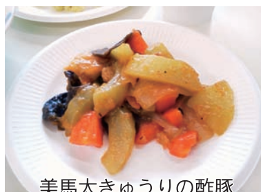
美馬太きゅうりの酢豚

調理の方法は、皮をむき、種の部分をスプーン等で取り除いてください。普通のきゅうり同様に生で使っていただけですが、形が崩れにくいので、煮たり、炒めたりしても美味しくいただけます。玉ねぎと同じ使い方、カレーやハヤシライス、酢豚、スープなどにもご利用ください。