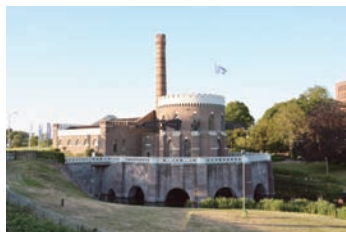
クルヴィウス排水機場

1836年に2つの嵐で湖からあふれ出した水がライデン市とアムステルダム市に迫ってきた時、当時の王様がハーレマーメール湖の水を排水すべきだと判断し、委員会を作りました。しかし、その後何の対処もしないまま時間が経過し、1839年に湖がまた近づいた時にやっと動き出し、1840年5月に「リングヴァールト」と「リングダイク」を作り始めました。「リングヴァールト」は日本語で「丸運河」、「リングダイク」は「丸堤防」という意味を持ち、名前の通り、湖の外側を取り囲んでいる運河と堤防です。8年間で、長さ約60キロメートル、高さ70センチから170センチまでの堤防ができました。