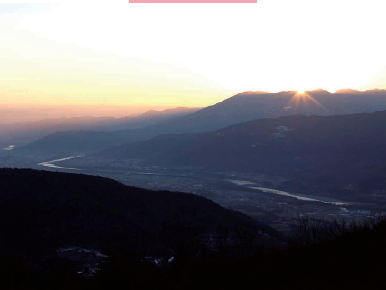
日の出（美馬町三頭山から望む）