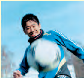
スポーツは育てることできる。

スポーツ振興くじ助成は、totoの販売により得られる資金をもとに、地方公共団体及びスポーツ団体が行う、スポーツの振興を目的とする事業に対して行われます。