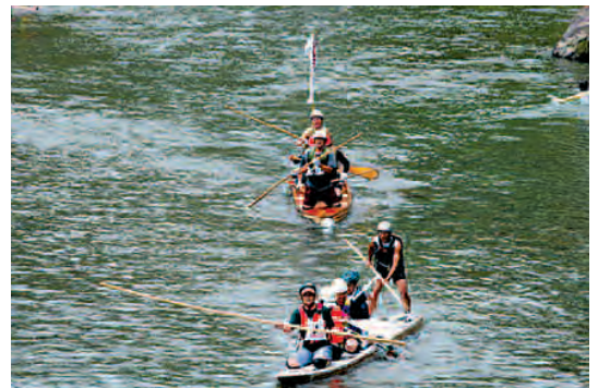
▲第27回大会写真コンテスト グランプリ作品「追いこせ!」

○その他 入賞者には9月中旬に個人通知します。応募作品は、同実行委員会に帰属し、返却しないのでご了承ください。入賞作品は市庁舎等で展示する予定です。