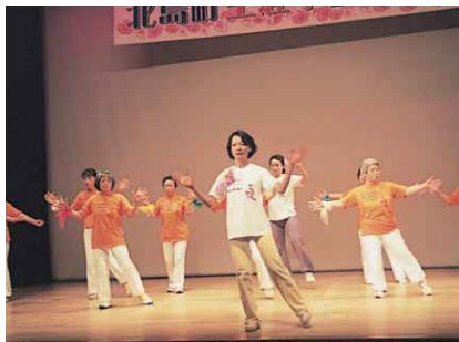
成果発表会でいきいきと発表するシルバークラスのみなさん

「自然体で楽しい生活習慣を生むこと、血管をしなやかにし血液をきれいにすること、代謝をはかるイメージを強く持ち、心体の動きを明るく、楽しみながら行うこと」を頭において、大勢の仲間と一緒に体操をしています。軽快なリズム体操やのびやかに行うリフレッシュ体操。また、羽衣や椅子、ボール、ゴム等を使って腹筋や大腰筋を鍛