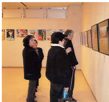
文化祭作品展示の様子

そして今回非常に大盛況だったのが、文化財展示室の「水神社天井絵」特別展示。約百年前に描かれた彩色豊かな美しい絵が天井絵として再現され、多くの方を魅了していました。