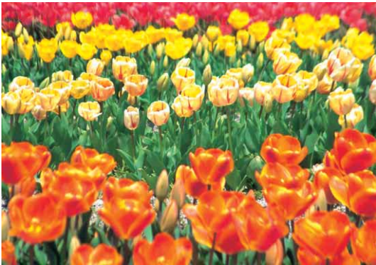
見事に咲き誇るチューリップ

北島町では昭和二十三年ごろからチューリップの栽培が開始されました。切花用チューリップの促成栽培の産地として、関西市場から認められるようになり、現在も栽培が続けられています。そして、平成七年には第一回北島町チューリップフェアが開催され、今年で第十四回目を迎えることになりました。