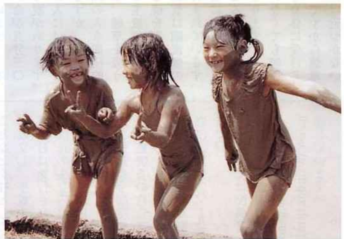
3位 金賞「泥んこあそび」