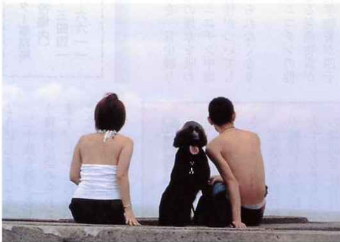
2位 県議会議長賞「海辺の休息」