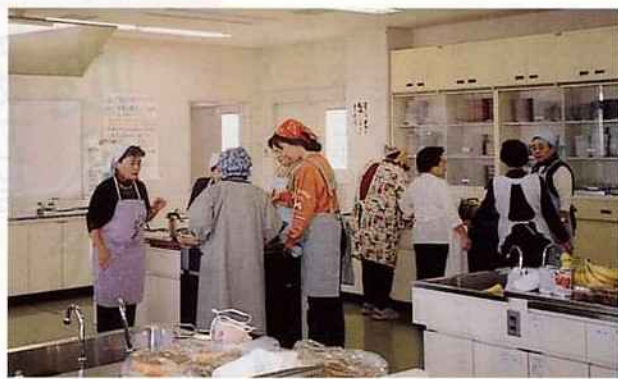
ラブハンズ北島の活動

この交流会は、ボランティア「ラブハンズ北島」の支援のもと、クリスマス会形式で開催され、今回で五回目となりました。当日の準備もボランティアだけでなく、メンバー全員も行う