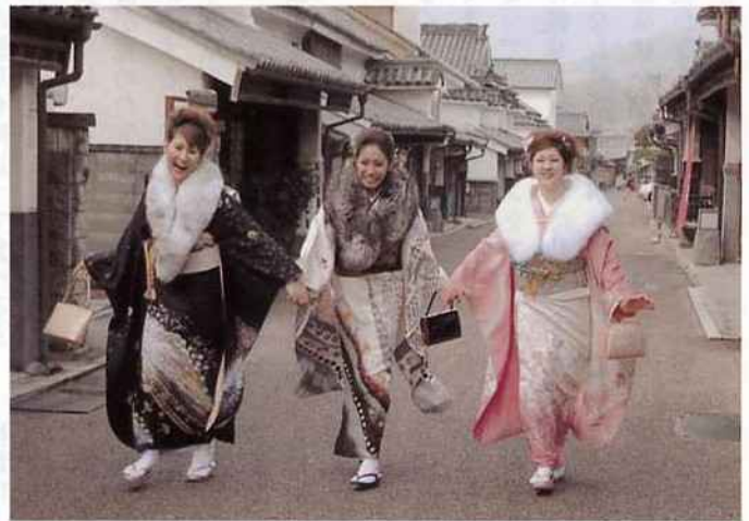
1位 知事賞「青春まんなか」

郷土文化会館で毎年行なわれる、ねりんピック(美術展)へ10名応募し、45点中、1、2、3位と上位を独占する快挙を成しとげました。私達写真教室は毎月2回の例会を開き、和気藹々の中で基礎を磨き、毎年数回は遠征をして腕を上げています。今迄は1人か2人の入賞でしたが、今年は大いに意気が上っているところです。