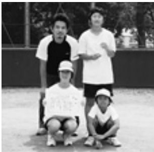
ペタンクの部 優勝 広野少女バレー 準優勝 鬼籠野A 第3位 中津A

この大会は昔から「大人と子どもが一緒に楽しみ、互いに励まし合おう」という素晴らしい伝統があり、それを受け継ぎ、未来へつなげる大会となったように思います。