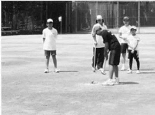
チームの協力が不可欠なグラウンドゴルフ

2種目ともに、初めて競技するにもかかわらず、グラウンドゴルフに7チーム、ペタンクには21チームが参加して競技を行いました。子ども達はとても楽しそうにプレーをし、一緒に競技した大人も子どもにも負けなくらいの笑顔と歓声を上げて、大いに会場を盛り上げました。