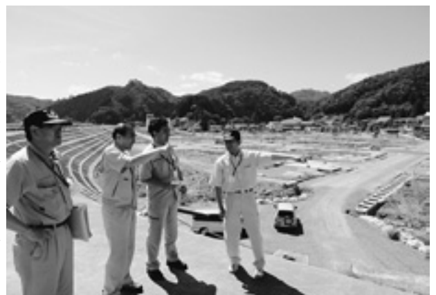
防潮堤の上から被害状況を確認

次いで、被災地を案内いただきました。車は田老地区に着く。「津波でんでこ」(津波が来ると思ったら家族に構わず逃げろ!)と語り継がれている町としても知られている。世界一を誇る防潮堤の上から辺りに目をやる。家も堤防も漁港も無惨に打ち砕かれ何も無い。遠くへ視線を向けると山と