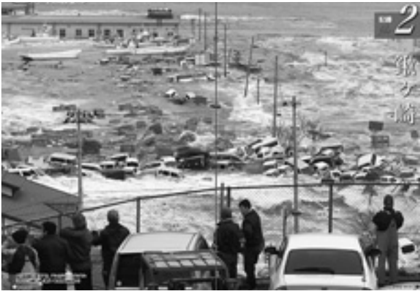
広報みやこ6月号から 漁港に押し寄せる津波