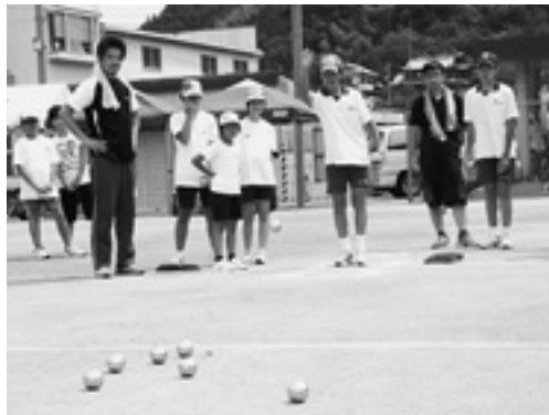
技術や戦術が重要なカギをにぎるペタンク