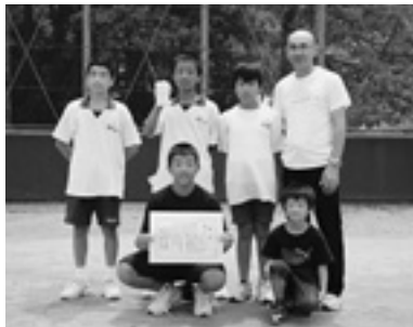
グラウンドゴルフの部 優勝 下分A 準優勝 下分B 第3位 神領西A