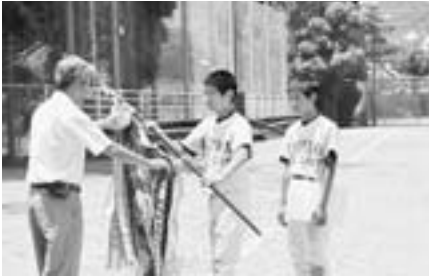
21年ぶりに優勝旗を手にする東中