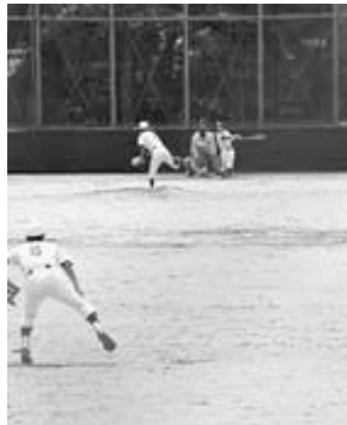
エースの投げ合いとなった決勝戦