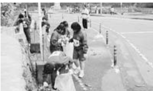
アドプト活動をする中学生