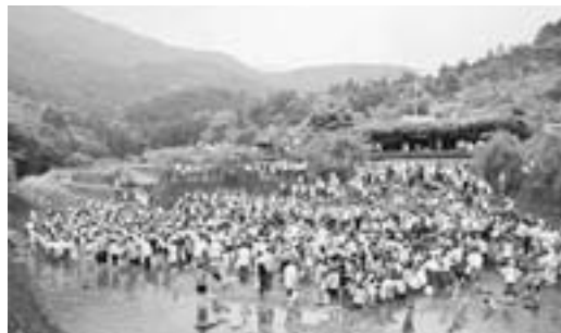
あめごつかみ取り