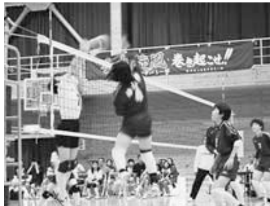
全試合ストレート勝ちの東中

リーグ戦で行われ、東中学校が全てストレート勝ちで優勝を果たしました。神山中学校も粘り強い守備で得失点差で準優勝を果たし、両校揃って県大会への切符を手に入れました。