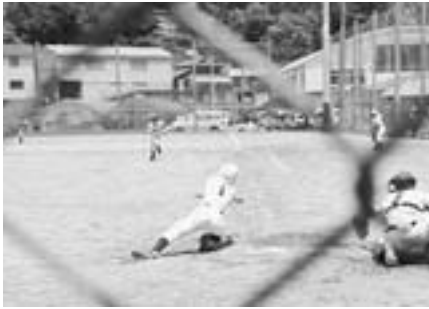
延長8回スクイズを外される