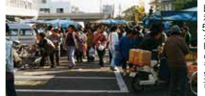
開設当初は転々としていたが、1974年(昭和49年)7月に阿南市スポーツセンター前広場に移転し、1991年(平成3年)9月から市民会館前で開設している。

第一次オイルショックによる物価の高騰を受け、1973年(昭和48年)5月、阿南市消費者協会が消費者生活の安定を図ろうと、「阿南市青空市の会」を結成したのが始まり。以来、生産者直売により、新鮮で安価な商品を提供し続けてきた。