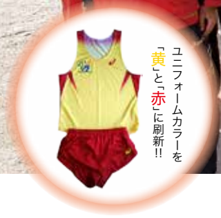
ユニフォームカラーを「黄」と「赤」に刷新!!