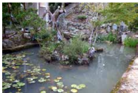
蓮池（此岸と彼岸を表す）

ダライ・ラマが、数ある仏教の教えの中から、被災した日本人に残した言葉は、「般若心経」の解説の一つである「利他心」であった。それは、私たち日本人の「生きる意味」につながるのである。