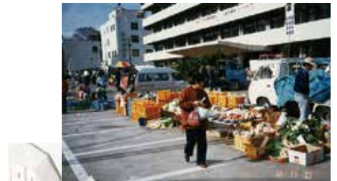
昭和59年頃の青空市