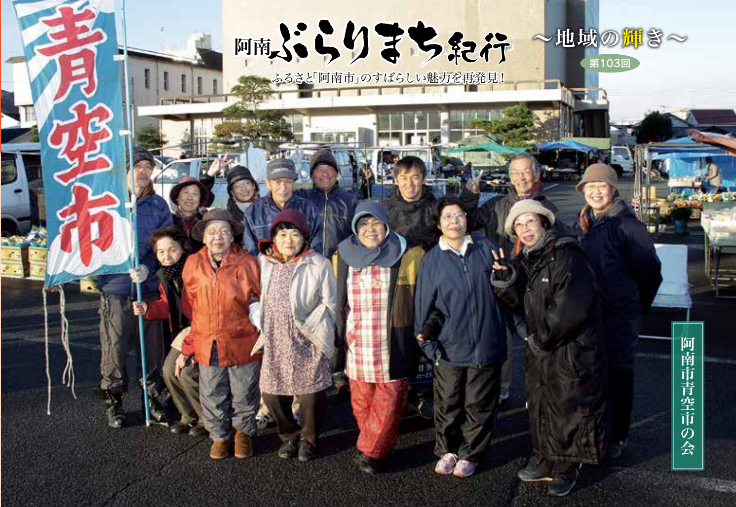
阿南市青空市の会

金曜日の早朝、阿南市市民会館の駐車場に、仮設テントがずらりと並ぶ。徳島の魅力を朝に詰め込み41年、「金曜日」の名でも親しまれている阿南市青空市。市内外から15店舗が出店し、季節の野菜や果物をはじめ、海産物の干物や花木、日用雑貨など豊富な品揃えで人気を集めている。