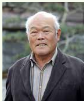
H13～ 民生委員・児童委員 H19～ 中野島地区会長 H25.12.1 に阿南市民生委員 児童委員協議会会長に就任

私たちは、人と人のつながりが希薄化している社会で、多くの悩みを抱えている人が増えているなか、特に生活困窮者の相談、支援、若い世代の子育ての相談等に迅速に対応するほか、高齢者、独居老人の安否確認や、災害に備えて自主防災会と連携し、要援護者の再確認など、相談支援の和を広げ、社会福祉活動に努力していきます。民生委員の活動は、ゆりかごから墓場まで幅広く奥深い活動が求められていますので、自ら自己学習を重ねるなど、地域住民が安心して住み続けることができる地域社会づくりを進めたいと思います。