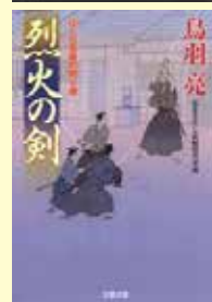
▲こんな作品が人気です