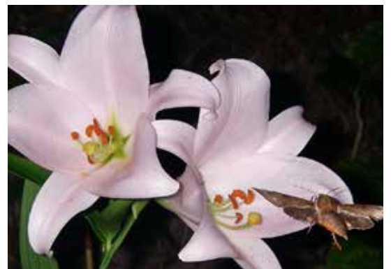
ササユリの蜜を食べに来たスズメガ

そこでササユリのおいの強さを調べてみると、昼はあまりにおいを出しませんが、午後8時頃に強いにおいを出していることが分かりました。これはササユリが蛾に見つけてもらうためににおいを調節しているためです。