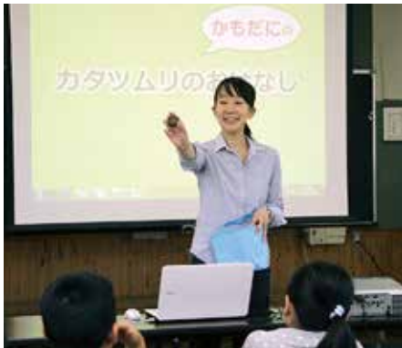
吉井小学校で出前授業をするようす

阿南市に生息する生き物の魅力のとりことなり、調査・研究を進められている3人の専門家に、生物多様性からみた地域活性化策などについて熱く語っていただきます。世界に誇れる阿南市の豊かな自然や生き物たちを知ることができる絶好の機会ですので、ぜひご参加ください。