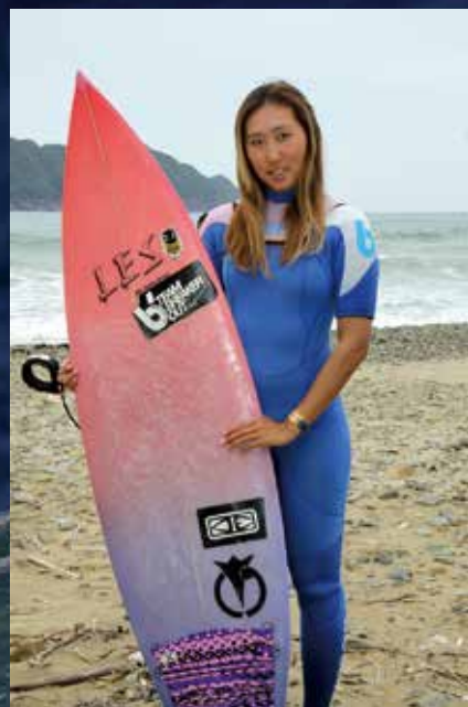
サーフィン歴10年。昨年度の国内ランキングは6位、現在の世界ランキングは56位。めざすは世界のトップサーファー。