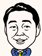
阿南市長 岩浅嘉仁