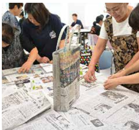
徳島新聞販売店協同組合「みつわ会」の皆さんの指導で、ボランティアスタッフが新聞エコバッグの試作をしました。参加者の資料袋に使用します。(8月18日)

阿南市の元気を発信するとともに、男女共同参画社会の実現に向けた意義ある大会にしようと、市民・企業・行政の協働により準備をしてきた「日本女性会議〈男女共同参画〉2013 あなん」がいよいよ来月開催します。全国から参加の皆さまを、まちをあげてもてなそうと、最終の準備をしています。ご協力をよろしく申し上げます。