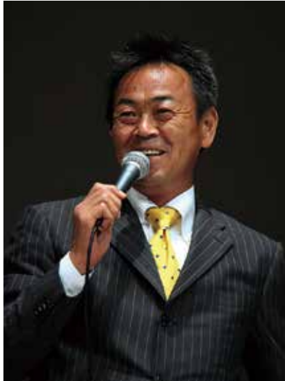
元プロ野球選手 水野雄仁 さん

12歳までを過ごした阿南市より委嘱いただいた「阿南ふるさと大使」を、たいへん光栄に感じ、背筋を正しています。ふるさととは今も、わたしを支えてくれ、育みつづけてくれます。これからは、少しでも恩返しができるよう、精一杯努めてまいります。阿南の良さを多くの方に伝えたいと思います。