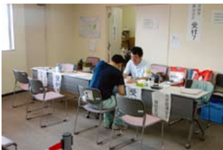
災害援護資金貸付の受付を行っているようです。