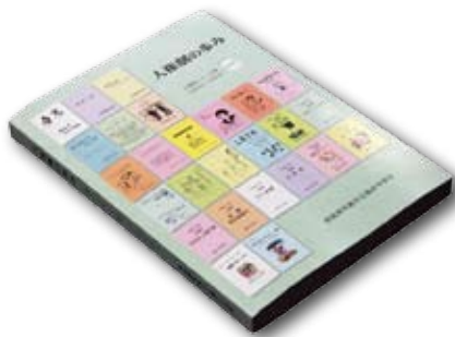
シナリオ集「人権劇の歩み」

ル」のなかで堂々と披露することができた。短期間ではあるが、人権劇に関わるスタッフ全員が完成をめざし、心をひとつにして取り組むことで達成感や成就感を味わうことができた。この夏休みに28作目のシナリオが完成する予定である。 公演当日は、多くの市民をはじめ保護者、小・中学生が鑑賞し、多くの方より賞賛の言葉をいただいた。生徒のなかには親子二代にわたって人権劇出演という生徒もあり、強力なサポートを受けている。昨年、これまでの人権劇26作のシナリオをまとめたシナリオ集「人権劇の歩み」を出版した。また、1作目からすべてDVDで映像として残している。そしてこれらは毎年、町内の人権教育地域座談会の資料として活用されている。