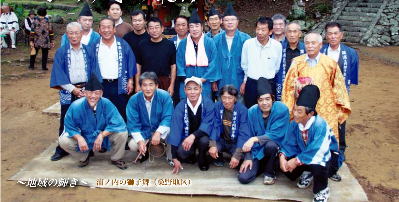
～地域の輝き～ 浦ノ内の獅子舞（桑野地区）

悠久の時を超えて今に受け継ぐ伝統の舞が 羽落神社と杉尾神社の例祭で奉納される 地域の誇りと伝統の灯を引き継ぐため ふるさとを愛する若連中が祭りを盛り上げる