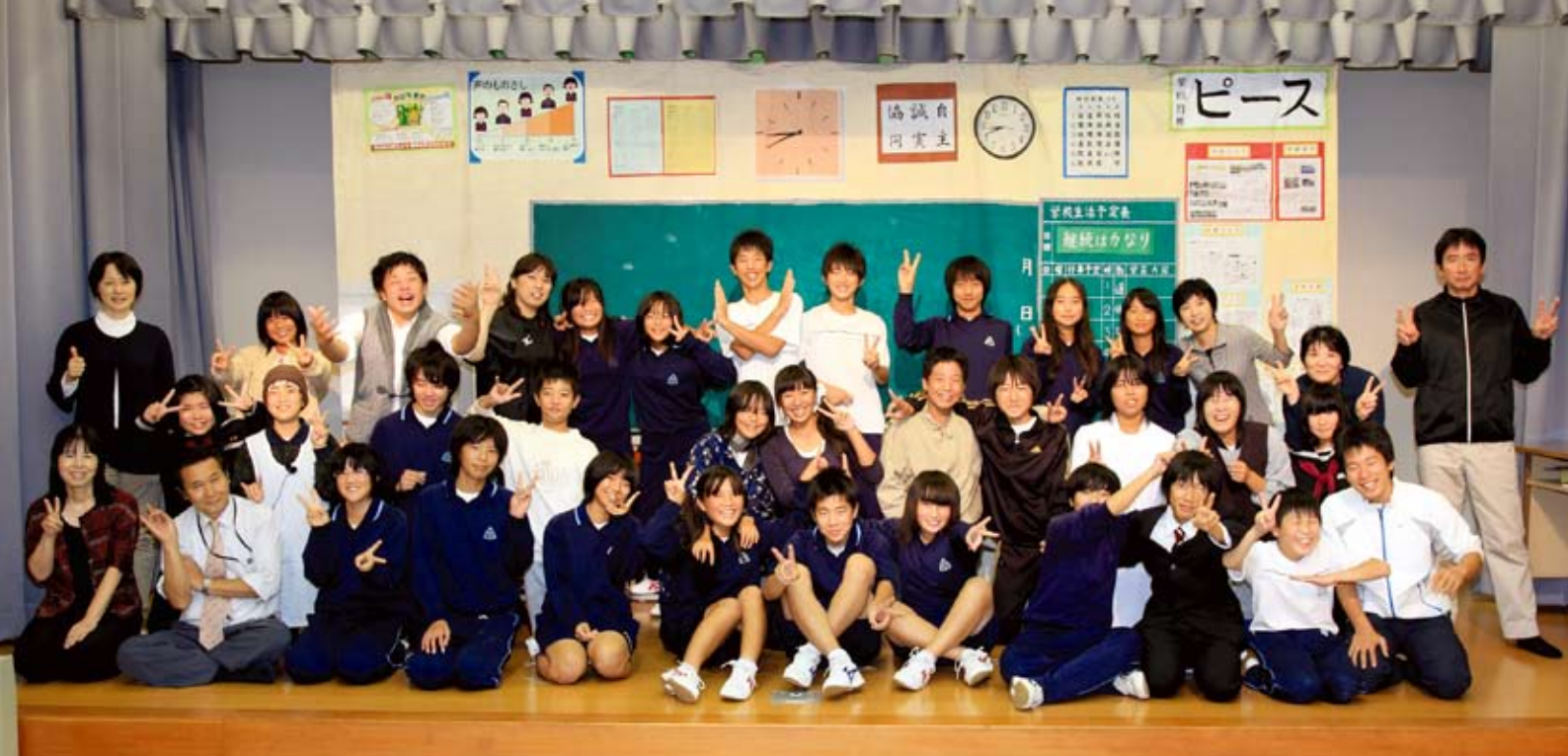
▲人権劇第28作「あいうえお」に出演された福井中学校2年生と教職員の皆さん（2011年10月23日：福井公民館にて上演）