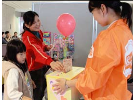
父母にメッセージカードを送るようす。

また、人気を集めていた「がん検診受診率向上プロジェクト」のコーナーでは、がん検診を受けてほしい父母にオリジナルメッセージカードを送るうと、たくさんのお母さんが詰めかけました。