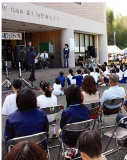
人権なぞかけのようす。

力を得て開催された。特設ステージでは、保育園児から大人までが参加して手話コーラスや人権なぞかけ等が行われ、さらに阿波踊りの鐘や太鼓、三味線の音が鳴り響く。また屋外テントでは、特別支援学校生徒や小・中のPTA、婦人会によるバザーや特産品販売など、盛りだくさんで活気あふれるものになった。中学生も、出店や人権コントなどで協力した。回を重ねる度に、より多くの人とふれあい、つながり合える大盛況のフェスティバルとなっている。