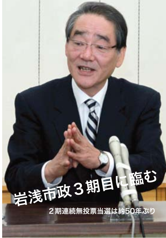
岩浅市政3期目に臨む