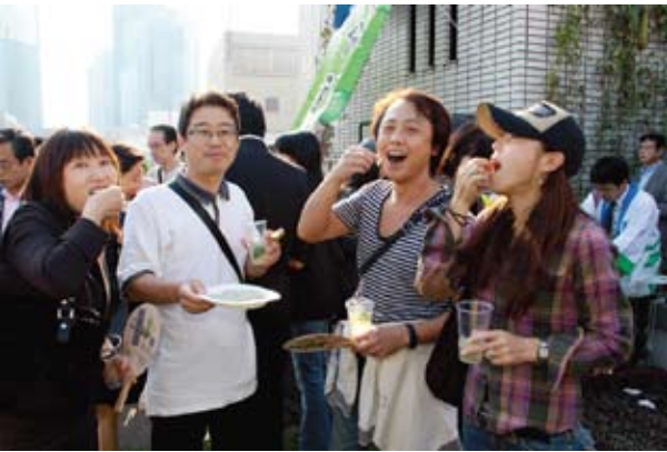
「すだちサワー」と「ちりめん」を味わう銀座の若者

市農林水産課の係長補佐は、「都会の人々に対する田舎（地方）の魅力は、そこにない『田んぼの緑』、『澄み切った青い空』や『深暗の星空』などの自然はもとより、そこに住む人々の生活様式そのものが発信源となっています。」