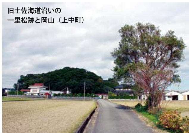
旧土佐海道沿いの一里松跡と岡山（上中町）

南島村に接する岡村には古墳時代後期の円墳があり、戦国時代には岡塚があつた。江戸時代には、土佐街道の要衝として南方からの海産物の中継地として栄え、一里松もあつた。