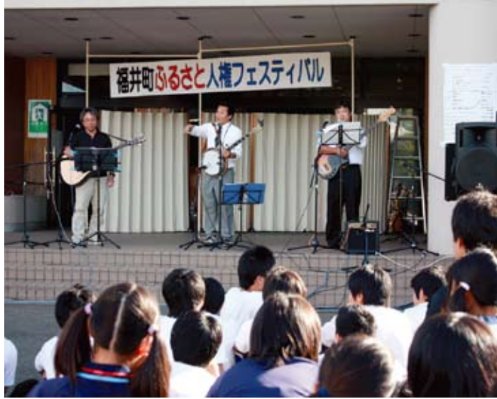
福井スペシャル人権ライブのようす。