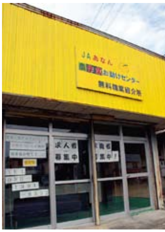
旧食肉センターを改修して開設された「農作業お助けセンター」

7年前、64戸あったハウスすだち農家は、現在では52戸にまで減り、その約8割が60歳以上と高齢化が進んでいる。担い手が育たない理由はさまざまだが、ハウスすだちは露地ものに比べ重油やハウス資材といったコストが大きな負担になっている。それに見合うだけの収入が見込まれなければ就農意欲は生まれてこない。こうしたことはハウスすだち産業に限ったことではないが、周年供給体制を強みに販売戦略を展開しているだけに、生産基盤の弱体化は死活問題といえる。