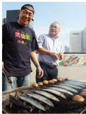
気仙沼産のさんまにすだち文句なしに最高でしょう！

つまり、「都会で田舎暮らしする」コンセプトで、交流していくことも一つの方策です。」と話している。