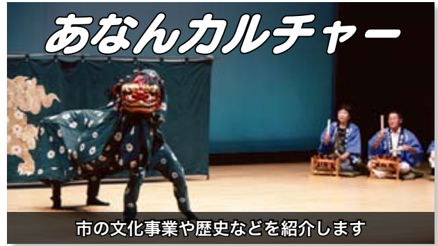
市の文化事業や歴史などを紹介します