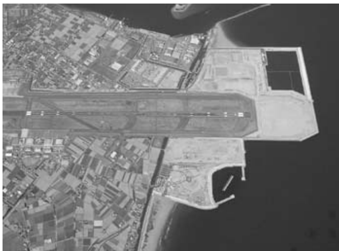
現在は、海上自衛隊徳島航空基地となっている。

出撃した敷島隊五機が、スルアン島沖のアメリカ空母部隊に体当たりを敢行し全員戦死した。特攻によって護衛空母一隻撃沈、同中破一隻、同小破一隻の大戦果をあげた。