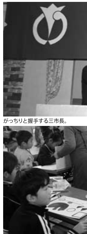
がっちり握手する三市長。