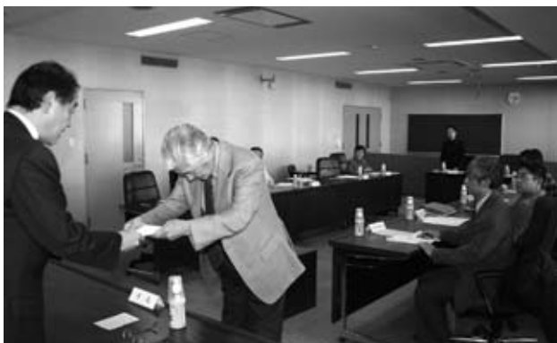
平尾懇話会会長から岩浅市長に報告書が手わたされているようす。