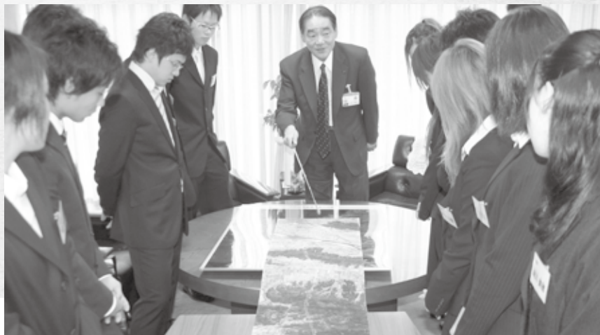
新成人たちに説明をする岩浅市長

物とかも徳島市内や県外に出かけていく機会が多いので、阿南でそれができるようなショッピングビルがあったらいいでしょうね。