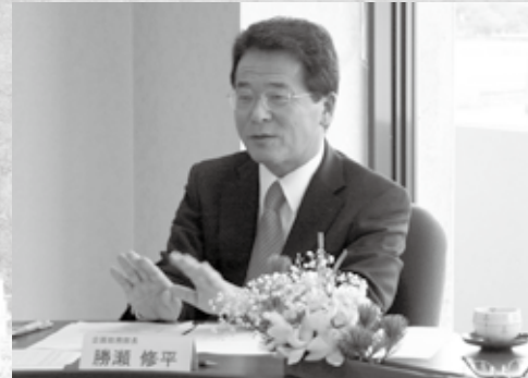
司会を務めた勝瀬企画総務部長