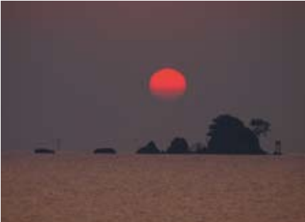
②後戸(福井町)の朝日