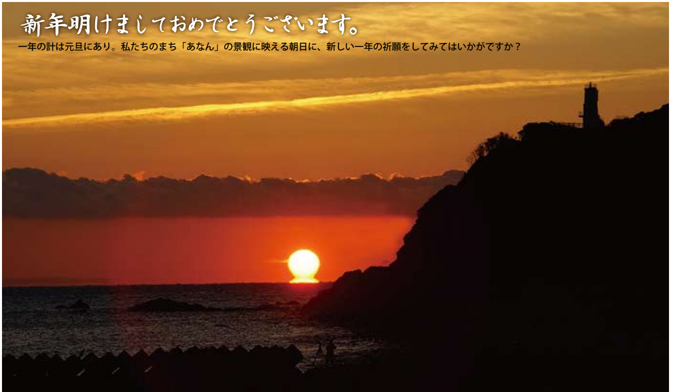
①蒲生田岬のだるま朝日 冷たく空気の澄んだ朝、朱色に染まる空に灯台のシルエットが重なる。見る者に幸運をもたらすとされているだるま朝日に遭遇できるかも。

一年の計は元旦にあり。私たちのまち「あなん」の景観に映える朝日に、新しい一年の祈願をしてみたいはいかがですか？