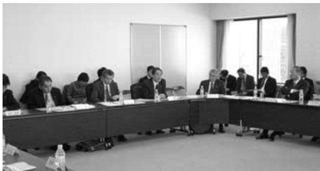
次世代エネルギーパーク推進会議のようす。

審査のポイントは、鶏の体型や色、つや、姿勢など総合評価だそうです。美しく育てる秘訣は、えさときれいな水にあるとのことでした。なおこの品評会は市の文化祭の一環として26年間続いています。