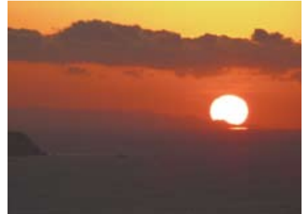
④津峯山からの朝焼け

点在する岩間から昇る太陽。風光明媚な海岸と空に漂う雲が時とともに変化する情景も楽しめる。