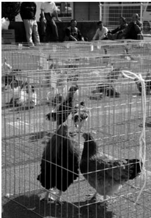
さまざまな鶏が出品されているようす。