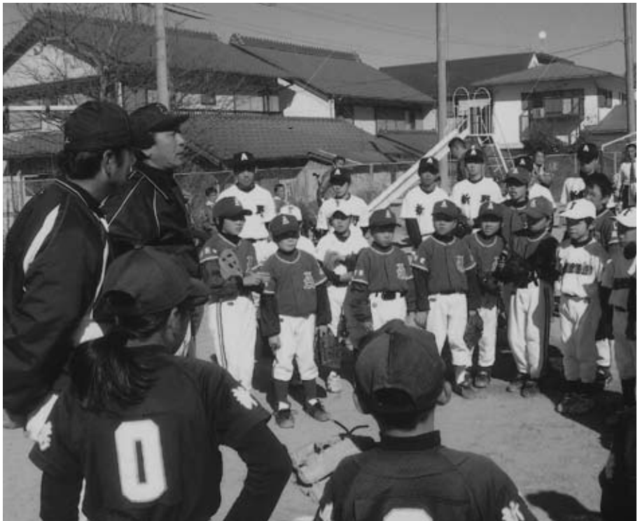
プロ現役コーチの話を熱心に聞く野球少年たち。