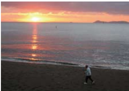
⑤北ノ脇海岸の日の出