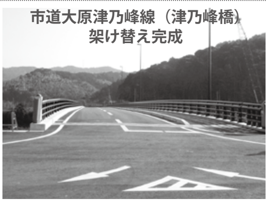
市道大原津乃峰線（津乃峰橋） 架け替え完成

計画の内容は、市役所をはじめ主だった公共施設に置いてある推進計画書でご覧ください。市民の皆様がこの計画の実現に向けて共に歩んでくださるようお願いいたします。 問い合わせは 学校教育課 (☎22-3390)へ