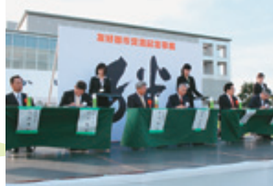
災害相互応援協定書署名

南海・東南海地震で想定されているような大規模災害に対処するためには、市町村が互いに信頼と連携を深め、手を取り合っって強固な結束に基づいたまちづくりを目指す必要があります。本町では、今後30年以内の発生確率が約60%と予想されている南海地震に備えるため、このたび築いた絆を防災に役立てていきたいと考えています。