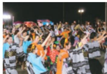
河北町の皆さんと阿波踊り