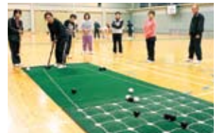
囲碁ボールを楽しむ参加者