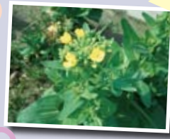
チンゲンサイの花

チンゲンサイの旬は1月から3月ですが、藍住町ではハウスで1年を通しておいしく生産されています。栽培面積は約4ヘクタール、生産量は83トンで、県下第4位の生産地となっています。最近では、新作物として試作研究を進めてきたミニチンゲンサイも生産されており、地場農産物として町の学校給食にも使用され、子どもたちにも好評です。※レシピを町ホームページに掲載しています。おいしい体験をしてください。