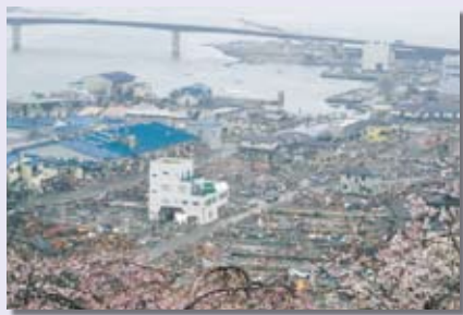
石巻市を見下ろす。奥に見えるのが、石巻港と日和大橋。

今回、短い期間ではありましたが、本当に行つてよかつたと思つています。復興にはまだまだ時間がかかると思いますが、しかし、営業を再開する店もあり少しずつですが復旧・回復してきていると感じました。大切なことは、支援を継続することだと思