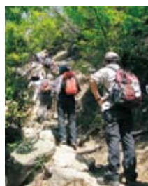
2010春の軽登山「六甲山」