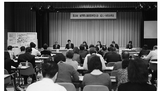
【第53回 板野郡人権教育研究大会成人・女性分科会】

自分の身近なこととして、また自分のこととして考えられたとき「怒り」がこみ上げてくるのではないのでしょうか。