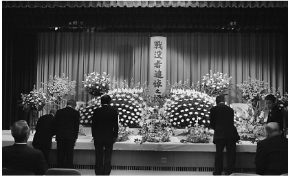
献花をされる遺族の方々

当日は遺族ら150人を超える関係者の出席があり日清戦争から第二次世界大戦までに戦没された445人の方のご冥福をお祈りし