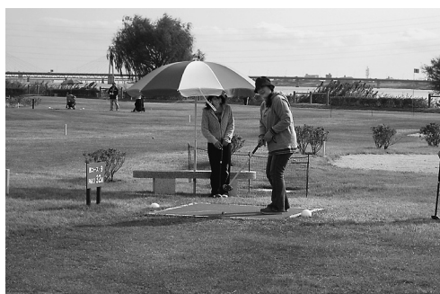
自然の中でプレーを楽しむ参加者