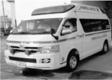
(社)日本損害保険協会から寄贈された高規格救急車

今回の寄贈により、第1消防署に1台、第2消防署に2台、計3台の救急車が全て高規格救急車となり12月末から運用を開始しています。今後とも引き続き救急体制の充実と強化に取り組んで参りますので、住民の皆さんのご理解とご協力をお願いいたします。