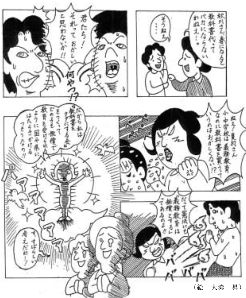
(絵 大湾 昇)

今は当たり前のように配られている教科書ですが、次のような親たちの思いや運動があったおかげで、およそ40年もの間、すべての小・中学生に、無償（無料）で教科書が配られているのです。