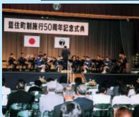
徳島県警察音楽隊