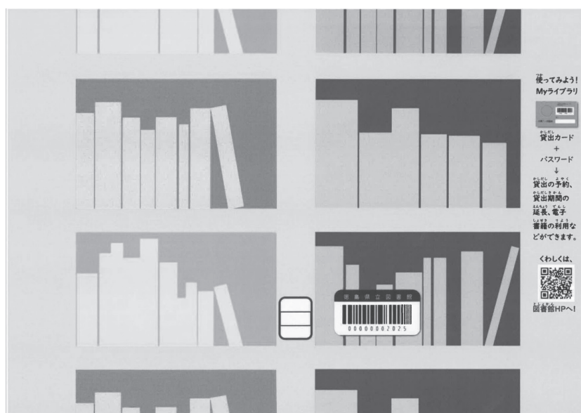
(配布したブックカバー)

令和7年6月9日からは、リニューアルオープンの準備のため再度臨時休館とし、6月24日にリニューアルオープンした。リニューアルオープン当日は、入館者に先着でオリジナルブックカバーを配布し、「県立図書館リニューアル」と題した企画展を行った。また、7月には新しくなった図書館を見学して貰うため、図書館探検隊も開催した。