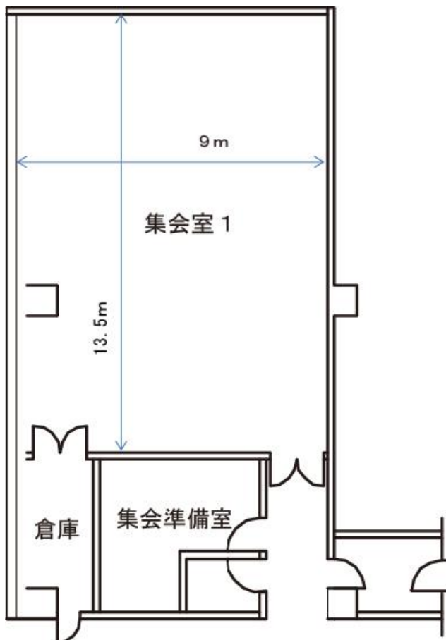
集会室 1 平面図